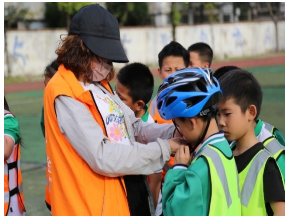
图 10 游戏名称：安全头盔接力赛 执行机构：孝感市义工联合会