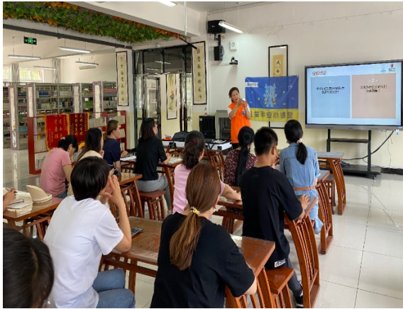
图 1 石嘴山市第十六小学教师工作坊 执行机构：大武口区善信公益服务中心