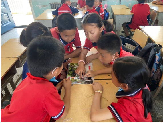
图 3 同学们在上交通安全课程 项目学校：石嘴山市丽日小学 执行机构：石嘴山市希望公益服务中心