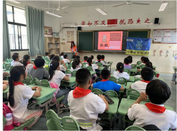
图 4 同学们在上消防安全课程 项目学校：高淳区漆桥中心小学 执行机构：淳青青少年服务中心