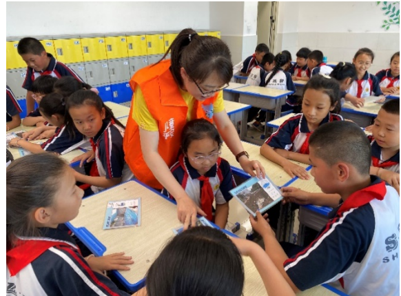
图 6 防溺水课堂上，同学们在进行小组讨论 项目学校：朔州市朔城区和丽中学 执行机构：朔州市社会工作协会