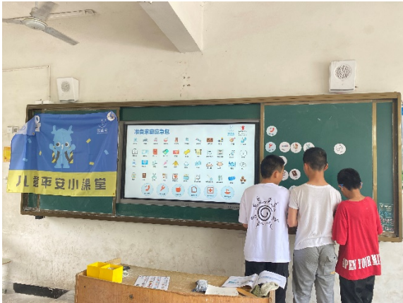
图 5 同学们在上地震课程 项目学校：德安县车桥学校 执行机构：德安义工联合会