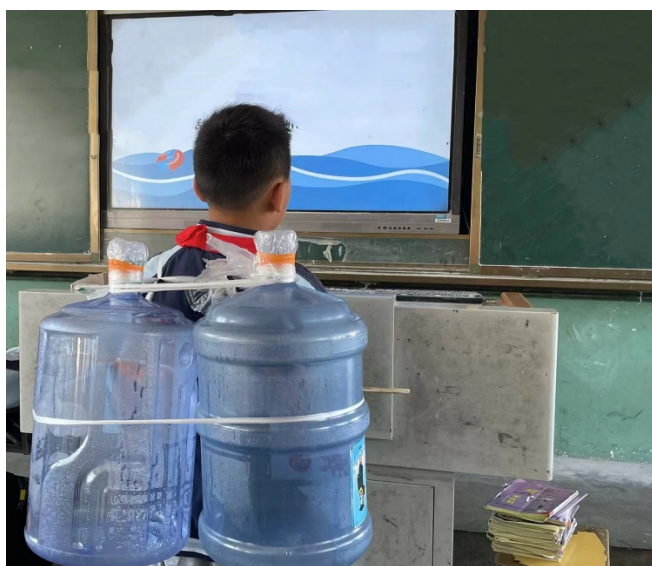
图 19 作品：自制防溺水漂浮物 作者：潘梓龙 项目学校：云梦县胡金店镇中心小学 执行机构：云梦县义工联合会