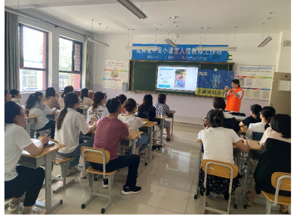
图 2 朔州市星辰双语学校教师工作坊 执行机构：朔州市社会工作协会