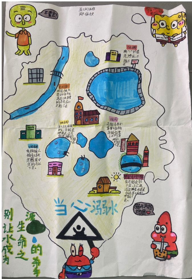
图 20 作品：防溺水风险图 作者：郑依欣 项目学校：茅家岭中心小学 执行机构：信州区繁星社会工作服务社