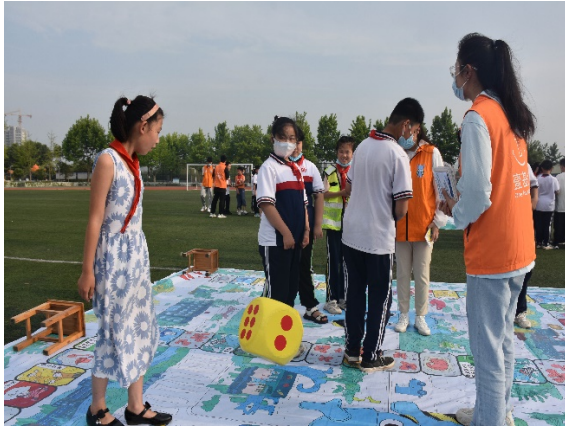
图 7 游戏名称：交通安全出行棋 执行机构：日照市阳光助残志愿者协会