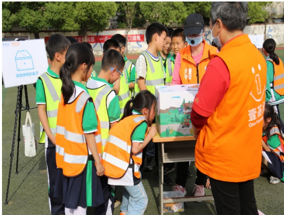
图 9 游戏名称：探索神奇的盒子 执行机构：孝感市义工联合会