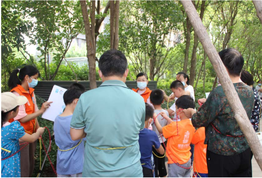
认真学习绳结的家长

“6月16日，在范县第二小学顺利开展了一场完美的儿童生存训练营活动，虽说一开始和学校校长沟通协调花费了不少时间，学校校长也是为了孩子，因为临近期末考试，还有就是最近河南持续的高温，担心孩子中暑，经过多次沟通协调，双方都满意的方案进行开展，时间定在了下午五点之后，教学楼的背阴处。此次活动不仅吸引了民政部门的领导进行参观，而且把我们范县电视台的记者吸引来了，由于我们志愿团队已有了前五场的经验，整场活动井然有序，讲师们边精彩的讲解，边带动孩子们参与，要点细致入微，孩子们也都能听懂学会。民政部门对我们的评价也非常高，说：“这些志愿者讲的真好，我看孩子们都能学的很快。”那个结绳挺有意思的，越拉越紧，还比较容易解开。我也学会了。“还说：“希望你们以后针对未成年安全，保护方面再多多开展，让更多的儿童受益，孩子们都是祖国的花朵，希望在我们的努力下，让孩子们都能健康成长。”民政部门的领导从开始就一直在，直到活动结束后才走，每经过一个活动都要学习一下。深深的被我们的活动吸引住了。还有我们范县电视台的记者，从活动开始一直到结束才走，拿着笨重的摄像机，不知辛苦的在每个活动场景录个不停，他们表示，关于儿童安全的活动在我们这边，我是第一次见，既新颖有趣，孩子们也喜欢，通过他们的实践，亲自动手参与比只是讲PPT的效果更显著。”