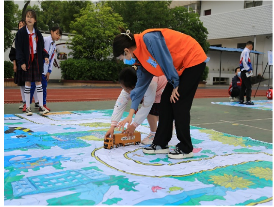
图 8 游戏名称：认识车辆内轮差 执行机构：孝感市义工联合会