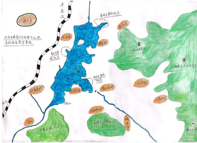
图 17 作品：防溺水风险图 作者：高煜家 项目学校：范阳小学 执行机构：淄博市城际救援队