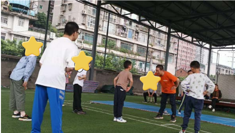
孩子们在接受训练