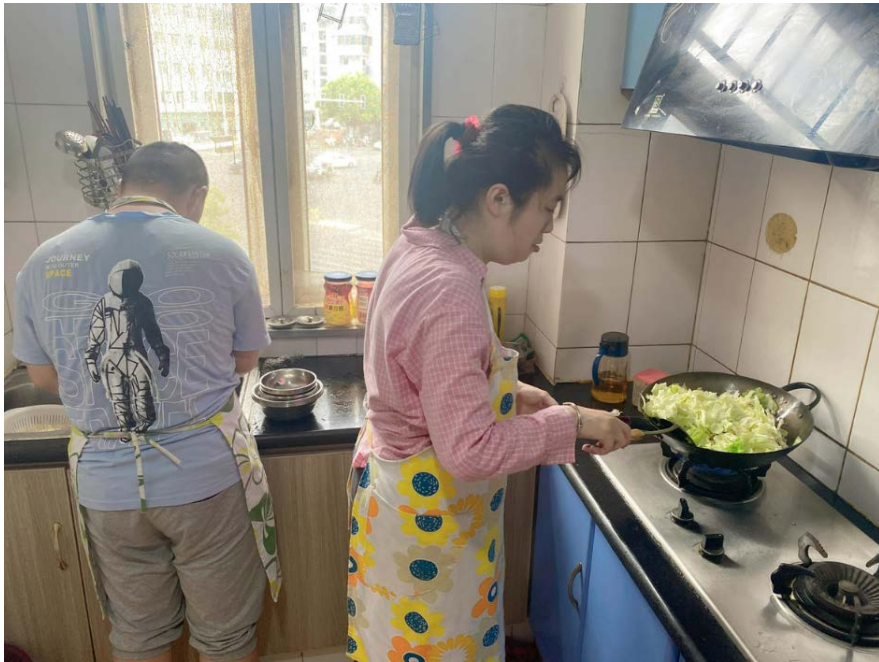
大龄孩子一起做饭