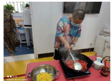
孩子们在进行生活化训练