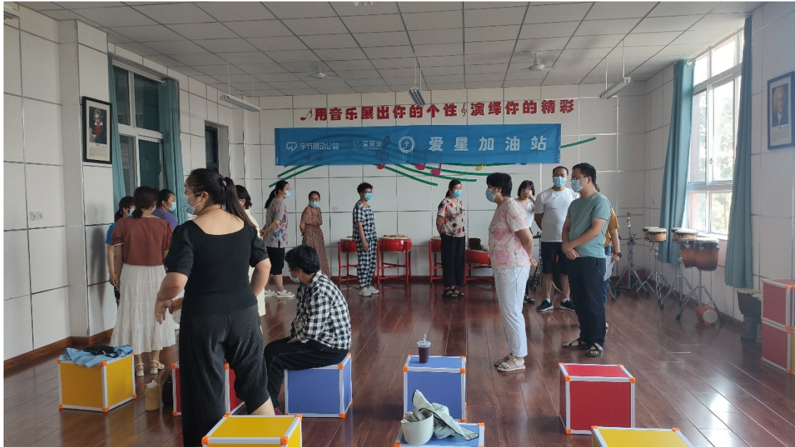
家长们在学习融合教育的知识