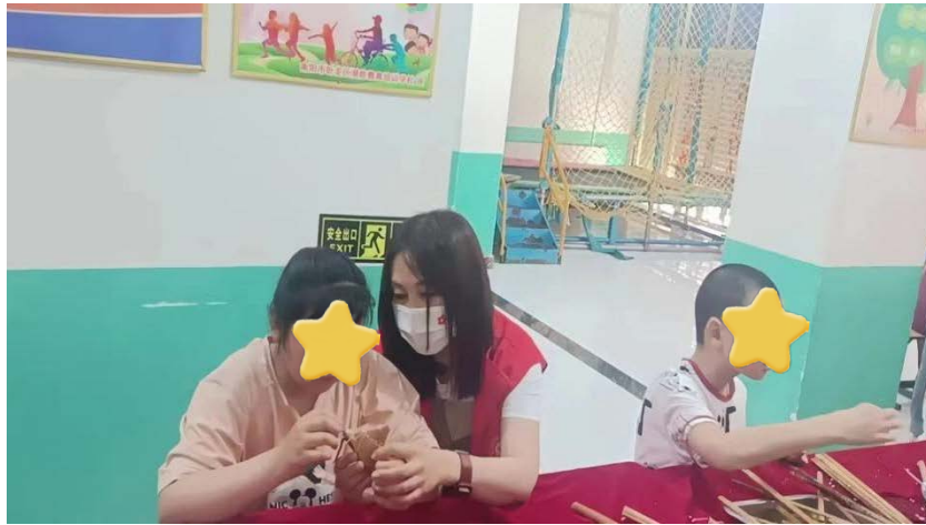
志愿者陪孩子包粽子