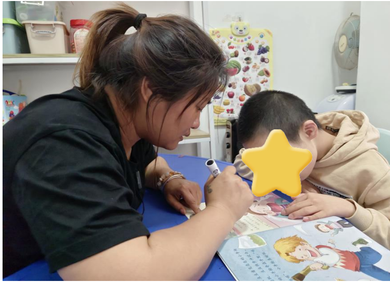
一对一认知个训课