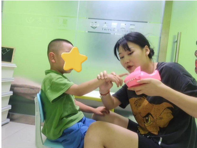
老师教涵宝认识鲨鱼的身体部位