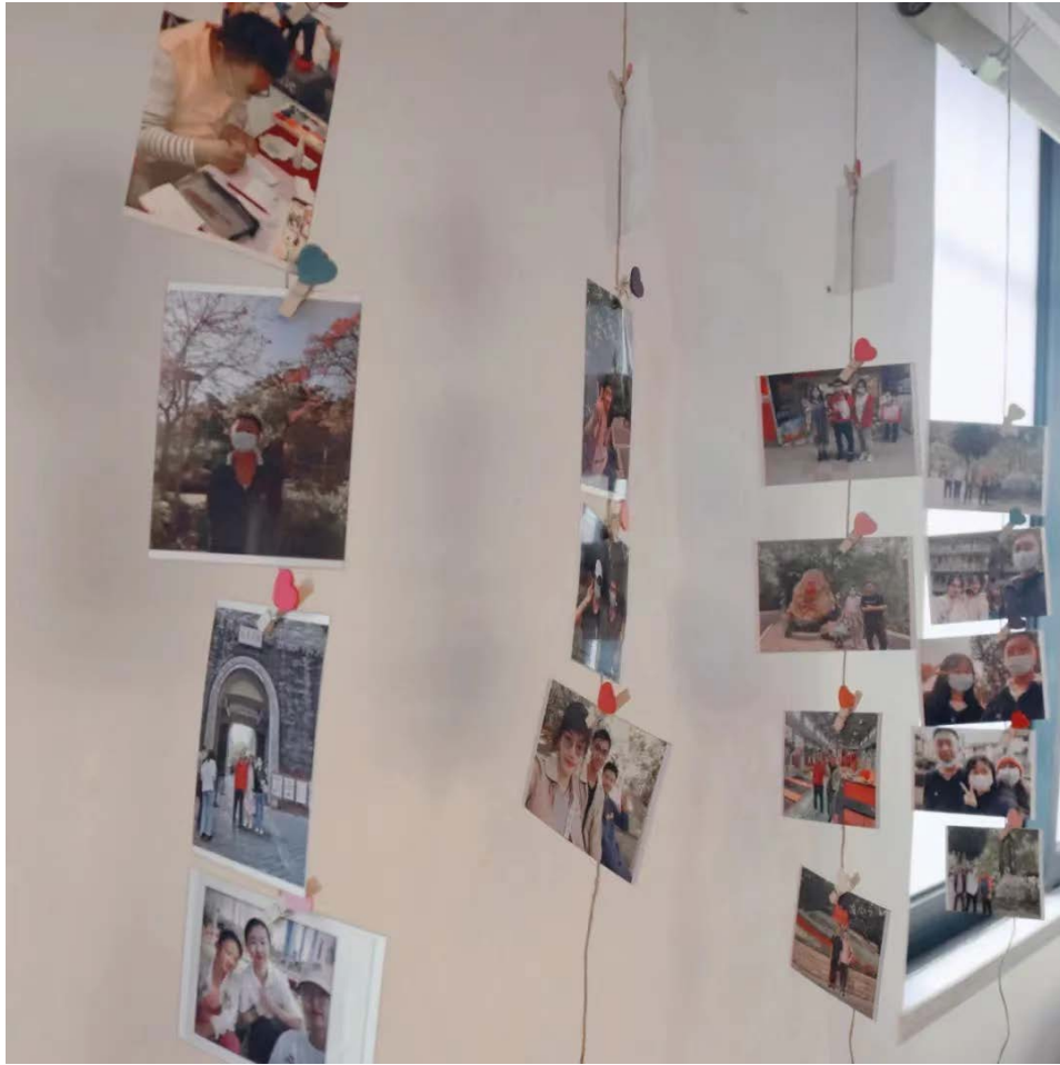
志愿者与心青年过去的点点滴滴