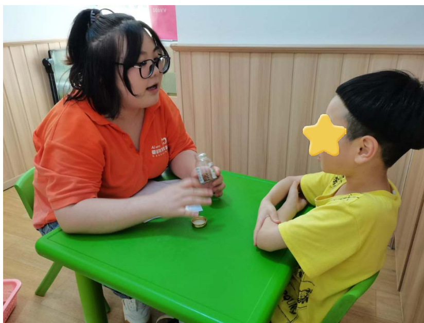
小朋友在上数学训练课

2022年6月，儿童们继续进行日常认知语言课的康复训练，经过系统的学习，培养他们学习、思考、应付环境和解决问题的能力，通过对语言的学习培养他们互相交换讯息、交流情意或者进行思维活动的的能力。儿童们在壹基金·爱萌星久久项目的帮助下，不断地学习和成长，虽然只是微小的进步，但家长们能在进步中看到康复的希望。