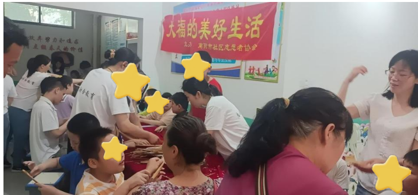
其乐融融的活动现场