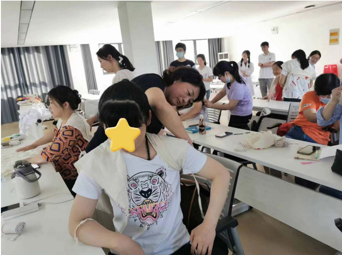
家长们在练习急救技能