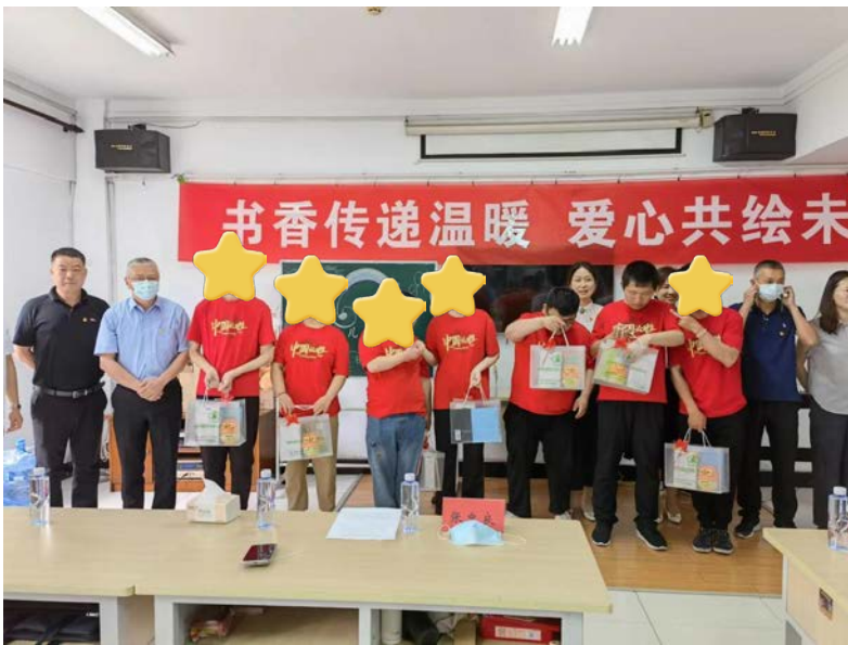
心智障碍青年在欢庆儿童节