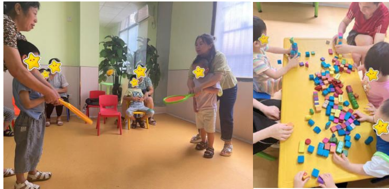
大运动协调性训练