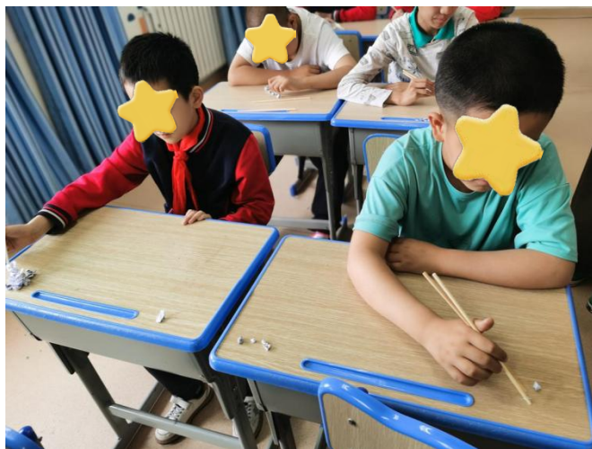
小朋友练习精细动作-2