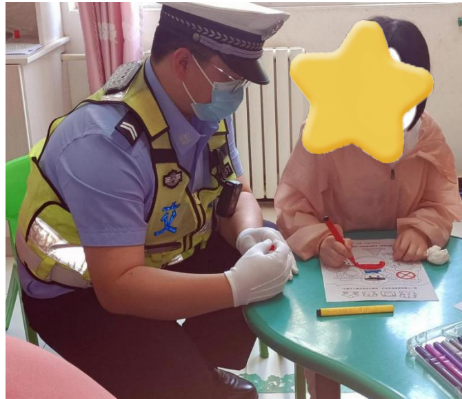
雨蝶在交警叔叔的陪伴下绘画