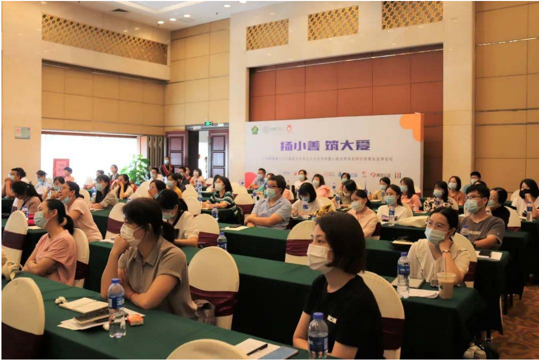
大会现场，与会者聚精会神地听课