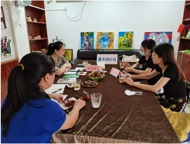
家长们在畅谈就业话题