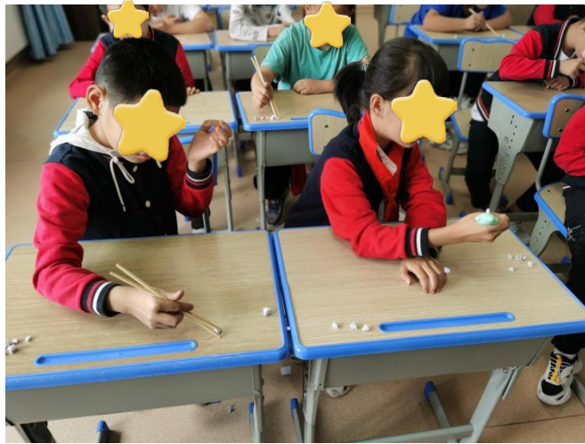
小朋友练习精细动作-1