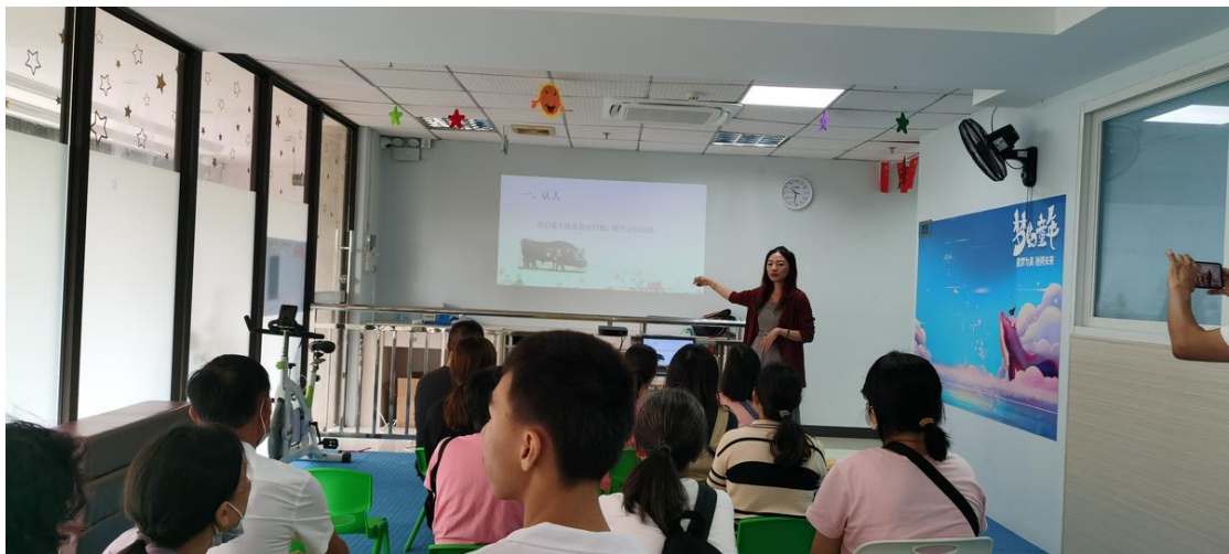
家长们在进行学习

家长在与心智障碍孩子相处过程中，如果不懂相关知识和技巧，往往很难理解他们的思维方式从而感到低效又挫败。为此，佛山智协特意邀请广州星之望特教俱乐部的心理老师，为家长们开设“如何跟特殊孩子相处与沟通”主题讲座，讲授与特殊孩子的相处之道，还为家长们传授缓解紧张、焦虑的方式和有效的减压方法。心理老师还根据孩子的填色画作，分析他们自身的性格与优缺点，有针对性地提供应对方式。讲解结束后，家长们纷纷提出各自的问题，心理老师皆作出分析和引导。