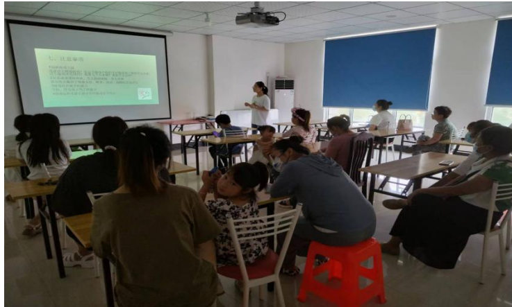
家长们在进行学习