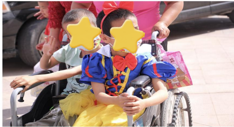
参加六一儿童节的活动