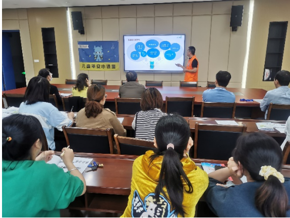
图 1 贵溪小学教师工作坊 执行机构：春草社会工作服务中心