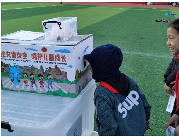
图 9 游戏名称：探索神奇的盒子 执行机构：成都市武侯区有你社区发展中心