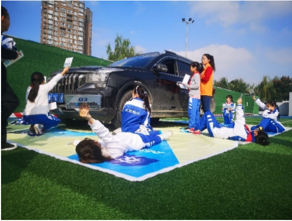
图 7 游戏名称：认识车辆盲区 执行机构：成都市爱有戏社区发展中心