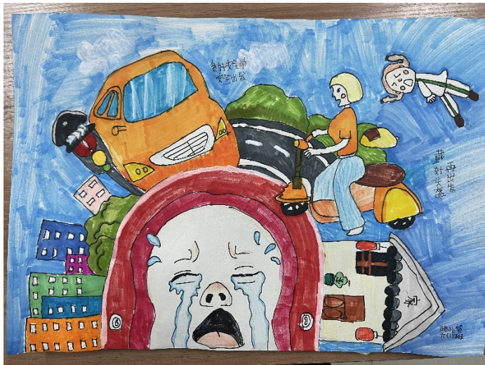
图 16 作品：交通安全宣传图 作者：陈忆宣 项目学校：上饶市信州区茅家岭中心小学 执行机构：上饶市信州区繁星社会工作服务社