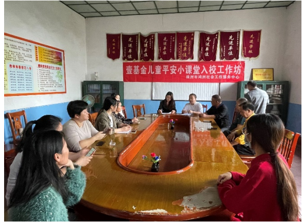
图 2 醴陵市左权镇兰谊小学教师工作坊 执行机构：株洲市鸿洲社会工作服务中心