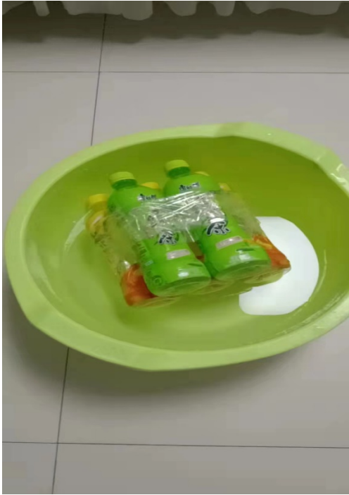
图 15 作品：自制防溺水漂浮物 作者：龙赫 项目学校：校场小学 执行机构：兰州市安宁区益兴社会工作服务中心