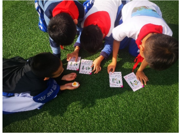
图 8 游戏名称：排排序 执行机构：成都市爱有戏社区发展中心