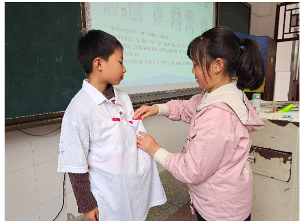
图 6 防溺水课堂上，同学们在制作紧急救生衣 项目学校：万州区凉水学校 执行机构：重庆市万州区江城公益慈善发展中心