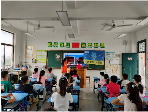
图 3 同学们在上交通安全课程 项目学校：岗集镇中心小学 执行机构：安徽省广善公益服务中心