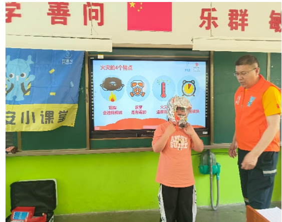
图 4 消防课上，同学在体验佩戴消防面罩 项目学校：堂邑镇中心小学 执行机构：聊城市车友帮救援队