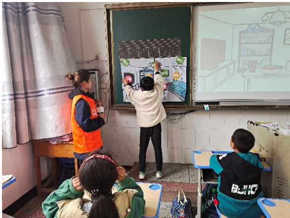
图 5 同学们在上地震课程 项目学校：万州区凉水学校 执行机构：重庆市万州区江城公益慈善发展中心