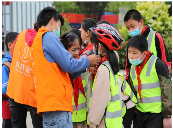
图 10 游戏名称：安全头盔接力赛 执行机构：孝感市义工联合会