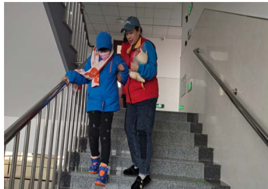
爱心志愿者搀扶着小女孩下楼梯