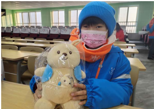
小女孩抱着带着属于自己的袋鼠玩偶