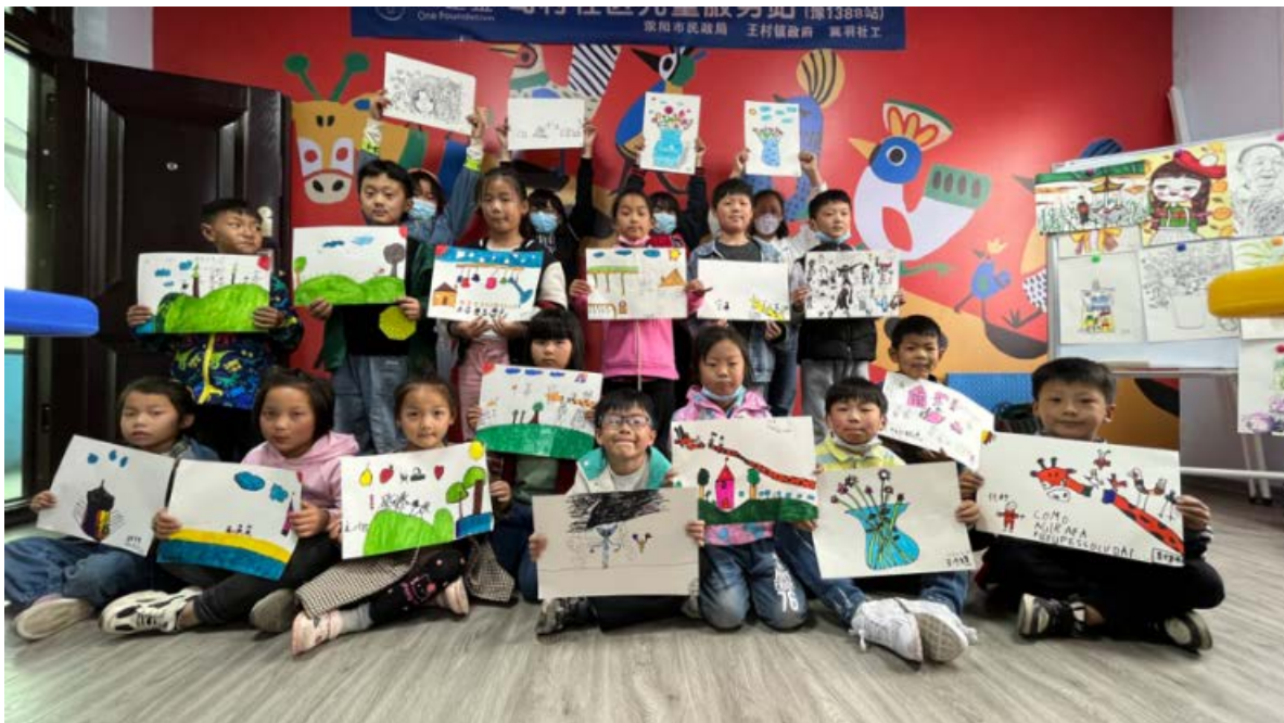
河南省荥阳市王村镇司村站点——画你所想

截至4月，该项目已有【6】个站点正常开站，共计开展【18】场活动，【230】人次儿童受益，【29】人次志愿者参与。发布【16】篇短视频、公众号等媒体传播。