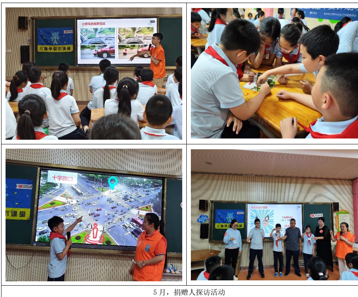
5月，捐赠人探访活动

② 5月11日，由支付宝公益平台爱心网友组成的捐赠人探访团来到了重庆市江津区菜市街小学实地探访壹基金儿童平安项目落地。此次探访活动不仅提升了儿童的交通安全意识，展现了公益资源转化为儿童安全防护能力的实践成果，更搭建了社会力量参与儿童保护的 platform，让更多人看见了专业社工参与儿童安全教育的力量。感谢支付宝公益及所有捐赠人的支持，期待未来能有更多支付宝公益爱心网友参与到这样的探访中，关注公益服务，关注儿童平安计划，为更多孩子筑牢安全防线，让每个孩子都能平安成长。