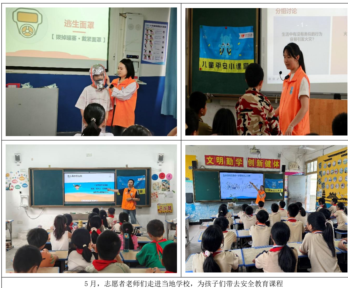
5月，志愿者老师们走进当地学校，为孩子们带去安全教育课程

小同学就急不可耐地喊了出来：“老师，我知道！不能去野泳！因为水里有水鬼！”话音一落，全班都笑了。我也笑了，但我知道，四年级的孩子对“危险”的理解，还停留在这样的想象里，得把他们的想象拉回到真实的世界。“水鬼倒是没有，但水里有比水鬼更可怕的东西——暗流、水草、深坑，还有你游不动的体力。这些，可都是真的。”小同学眨了眨眼，若有所思地坐下了。接着，我问了全班一个问题：“如果看见有人落水，你们会怎么做？”“跳下去救他！”好几个男生同时喊。我摇了摇头，故意问：“小明同学掉水里了，你跳下去救他，结果你也上不来，怎么办？”最前面一个男孩立刻说：“那就两个人都没了呀！”“对。”我认真地看着大家，“孩子们，今天最重要的一句话是——你们是小学生，你们的任务不是下水救人。如果遇到这种情况，你们最重要的任务，是保护好自己，然后大声呼救。”下课铃响了，孩子们围上来，七嘴八舌地说道。“老师，你下周还来吗？”“我把你讲的回去跟我弟弟说！”我笑着收拾教具，虽然这堂课只有四十分钟，但我相信，从今天起，这间教室里的几十个孩子，脑子里多了几根安全的弦。而这根弦，也许有一天，真的能拉住谁的手。