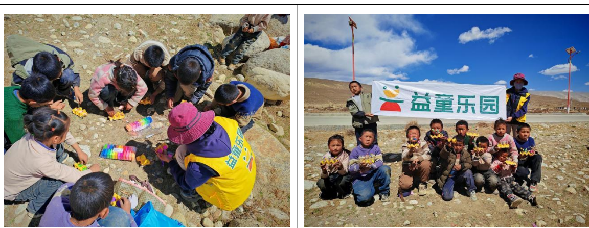
NO.004 西藏自治区日喀则市定日县尼辖乡亚白村站点——播种春天

亚白村益童乐园组织孩子们开展“播种春天”创意手工活动。定日气候寒冷，户外难见春日景致，站点专职便带领孩子们用彩泥、鸡蛋盒制作“播种开花”场景，大家积极动手，做出了一朵朵可爱的小花。此次活动让孩子们在动手创作中感受春天、收获快乐，丰富了周末生活。