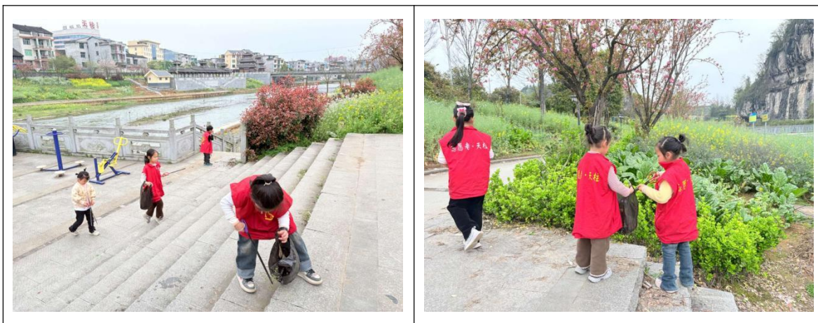
NO. 094 贵州省黔东南州天柱县联山街道幸福社区——争做环保小卫士

活动中，孩子们纷纷分享参与感受，有的说“原来河边的垃圾会污染河水，以后我再也不乱扔垃圾了”，有的开心表示“和小伙伴一起捡垃圾很有意义，看着干净的河边，特别有成就感”，还有的孩子主动承诺，会带动爸爸妈妈一起爱护河流、保护环境。