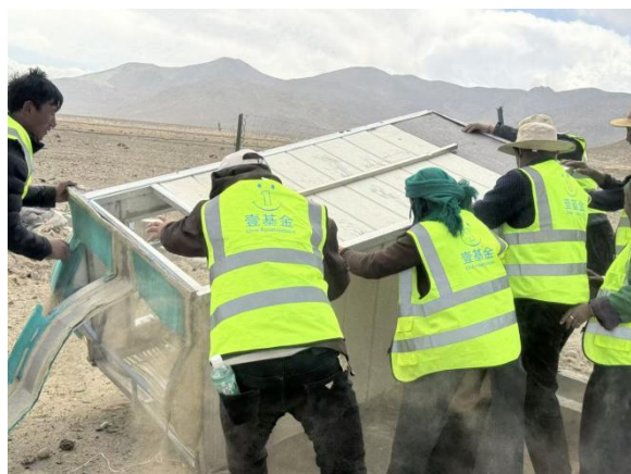
尼辖乡辖措村和亚白村开展志愿服务活动