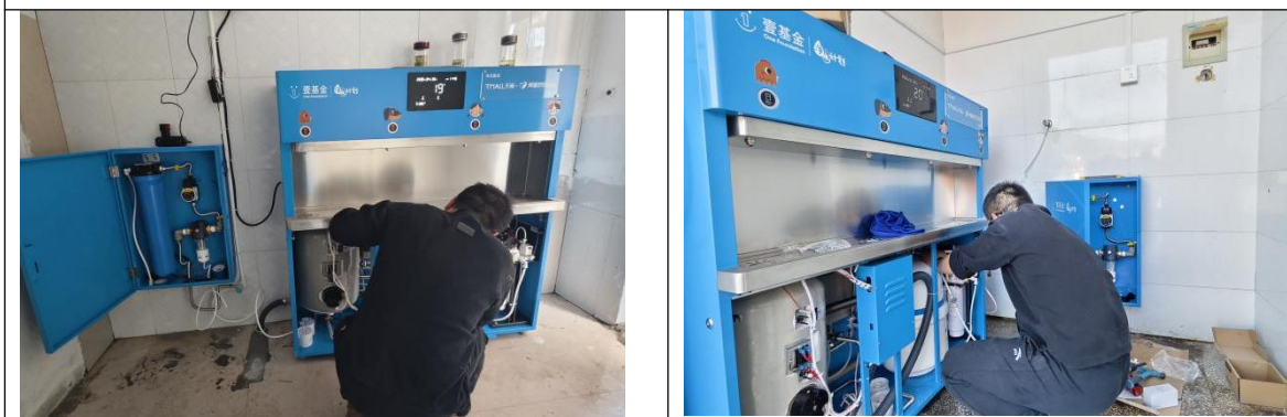
安徽岳西县项目校设备安装照片