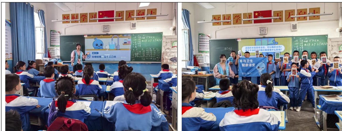
新疆疏附县项目校开展健康同行校园游园活动

2026年4月，净水计划项目在项目学校开展了37场健康同行校园游园活动。甘肃庄浪县合作伙伴前往3所学校开展了3场游园活动；湖北孝感市、广水市、樊城区合作伙伴前往4所学校开展了13场游园活动；山西左权县合作伙伴前往1所学校开展了1场游园活动；陕西泾阳县、西安市合作伙伴前往5所学校开展了5场游园活动；新疆吉木萨尔县、疏附县、胡杨河市等合作伙伴前往8所学校开展了15场游园活动。