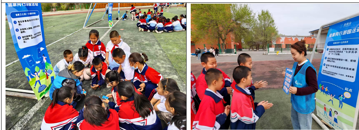
新疆生产建设兵团项目校开展健康同行校园游园活动