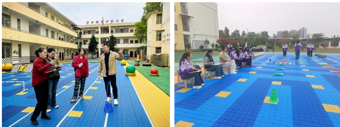
图：萌娃村运会-3月体育特色示范园线下指导精彩掠影