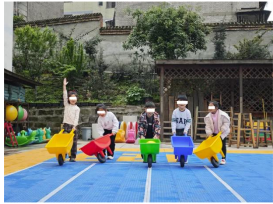
左：海阳市龙山街道中心幼儿园-儿童玩耍图 右：重庆市江津区李市幼儿园-儿童玩耍图