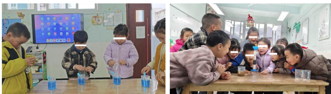
图：乡村儿童营养健康示范项目-“水”主题课程精彩掠影