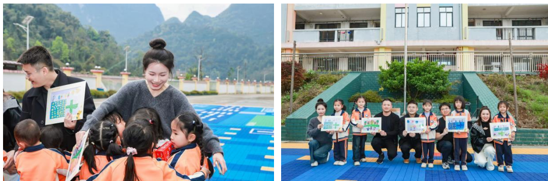
图：3月17日小天才操场回访精彩掠影