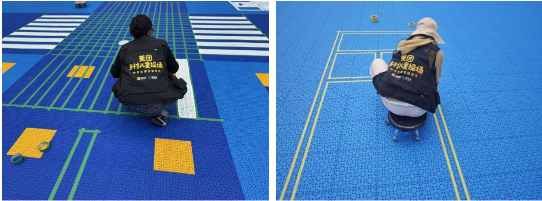
左：临猗县城关镇崇相西西关幼儿园-场地铺设照片 右：威宁彝族回族苗族自治县第二幼儿园-场地铺设照片