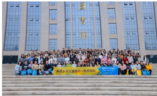
图：3月教师培训精彩掠影