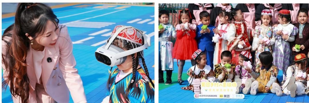
图：3月23日“云赏樱”活动精彩掠影