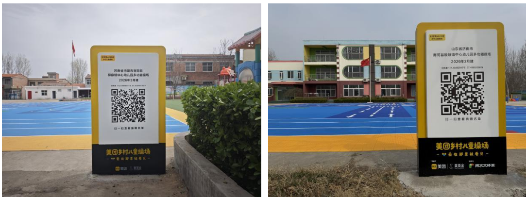
左：宜阳县柳泉镇中心幼儿园-铭牌场景照片 右：商河县殷巷镇中心幼儿园-铭牌场景照片