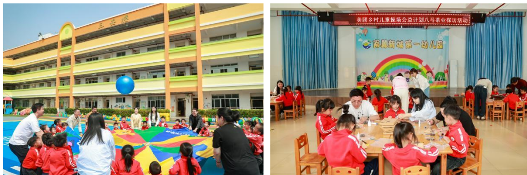
图：3月27日八马茶业操场回访精彩掠影