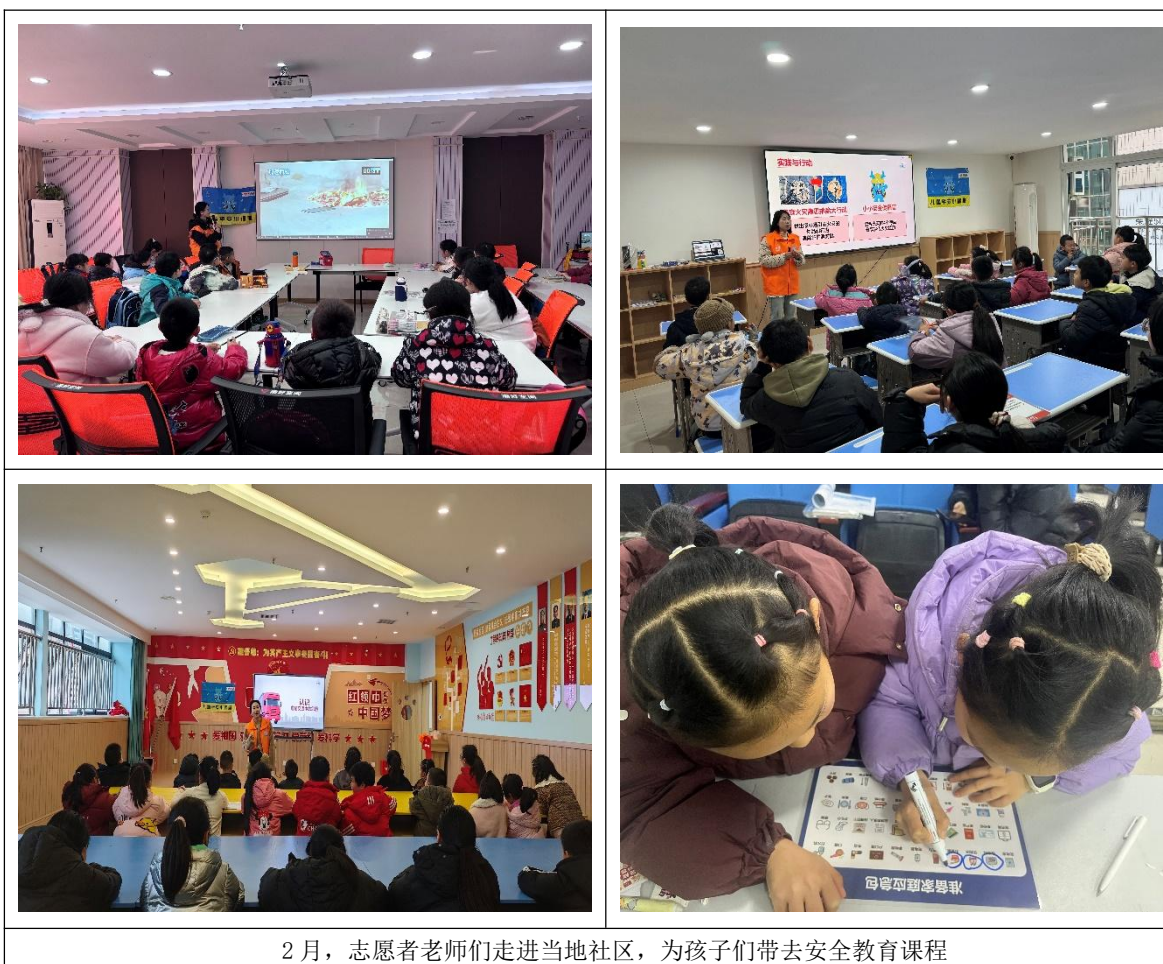
2月，志愿者老师们走进当地社区，为孩子们带去安全教育课程

人在地震发生时被困在废墟下大声喊救命的场景。不到三十秒，他就因为体力消耗过快而停止了呼救。我借此情形讲解道：在地震受困的极端环境下，体力是最宝贵的。随后，我带领全班同学闭上眼睛，让那位同学吹响口哨，大家瞬间感受到哨音的穿透力，不仅能帮助受困人员节省体力还能够穿越障碍，为救援人员引路。哨音停止后，教室里寂静无声。孩子们开始神情严肃地对照清单，认真思考救生背包里每一个物品的重要性。这个小插曲让课堂更进一步，它让孩子们明白：防灾减灾教育不存在雄心壮志的口号，而在于对每一个生存细节的敬畏与准备。这节课结束后，孩子们纷纷表示回家后的第一件事，就是和家长一起检查并完善家里的防灾急救包。