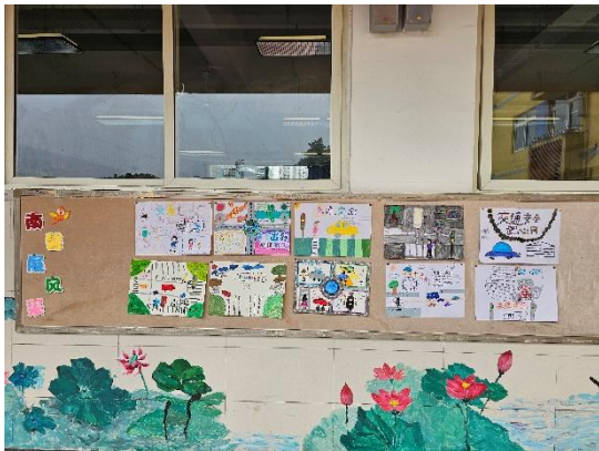
交通安全作品展示