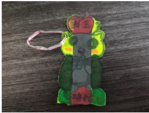
给书包制作反光挂饰