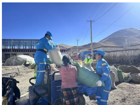
扎果镇切村开展志愿服务活动

2025 年 12 月，在支付宝公益平台及爱心网友的支持下，定日县措果乡、长所乡的 10 个行政村开展交通安全劝导、整理杂物，安全隐患排查等志愿服务活动 16 场，参与人数达 102 人次。