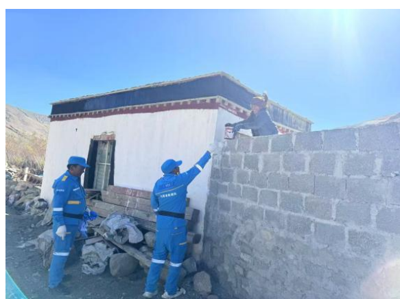
尼辖乡雪龙村和辖措村开展志愿服务活动