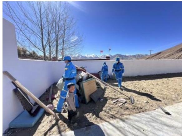
嘎白村和仁果村开展志愿服务活动