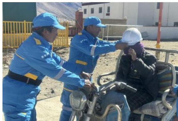
雪珠村和茶江村开展志愿服务活动