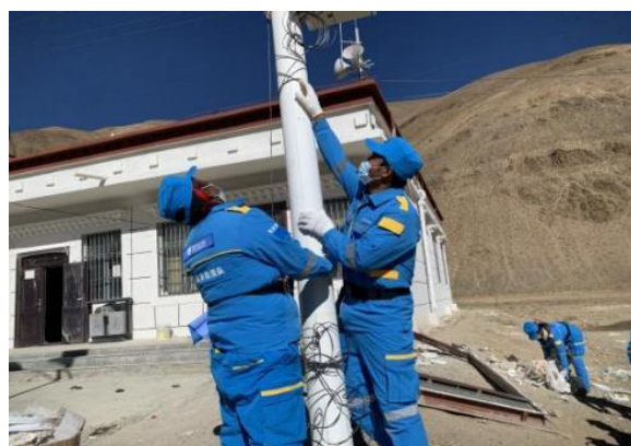
森嘎村和野江村开展志愿服务活动

2025 年 12 月，在腾讯公益平台及爱心网友的支持下，定日县措果乡、曲洛乡的 10 个行政村开展清扫灾痕，安全隐患排查，交通安全劝导等志愿服务活动 14 场，参与人数达 85 人次。