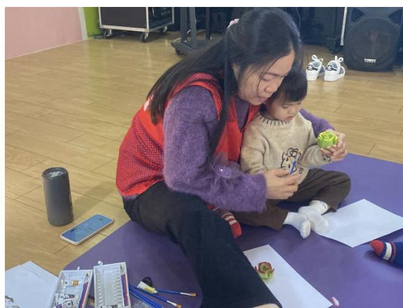
志愿者老师带领家长和孩子们做活动