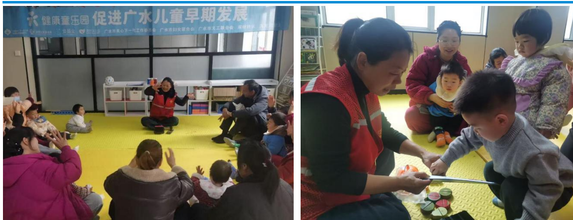
志愿者老师带领家长和孩子做活动