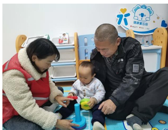
志愿者在进行入户走访、督导