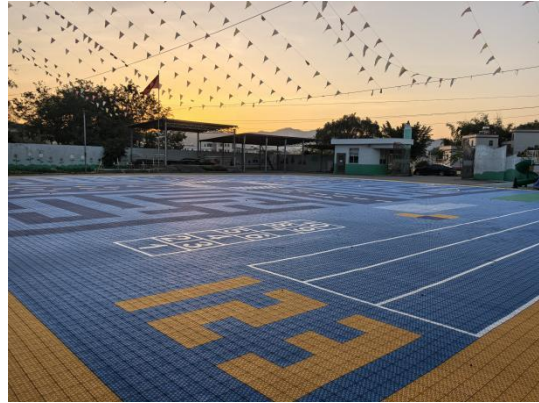
左：龙岩市新罗区小池中心幼儿园-铺设全景照片 右：紫金县好义镇中心幼儿园-铺设全景照片