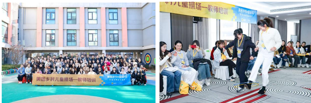
图：11月济南场教师培训精彩掠影