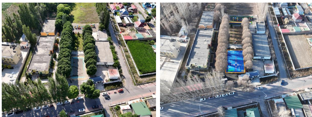
图：察布查尔锡伯自治县阔洪奇乡阔洪奇村幼儿园-铺设前后航拍图