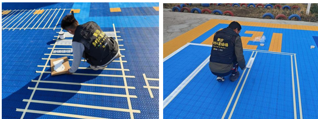
左：静海区中旺镇第一中心幼儿园-场地铺设照片 右：伊宁县巴依托海镇中心幼儿园上萨克于孜村分园-场地铺设照片