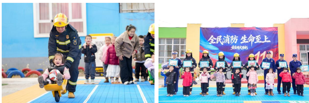
图：11月13日新疆消防操场回访精彩掠影