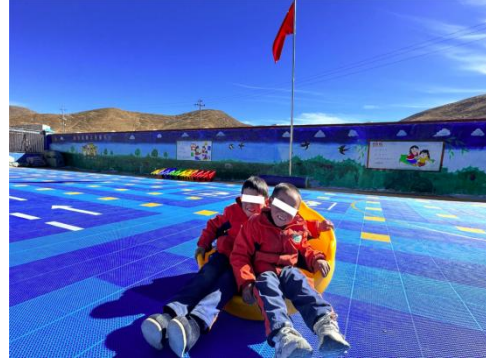
左：唐县北店头镇西同龙幼儿园-儿童玩耍图 右：谢通门县春哲乡幼儿园-儿童玩耍图