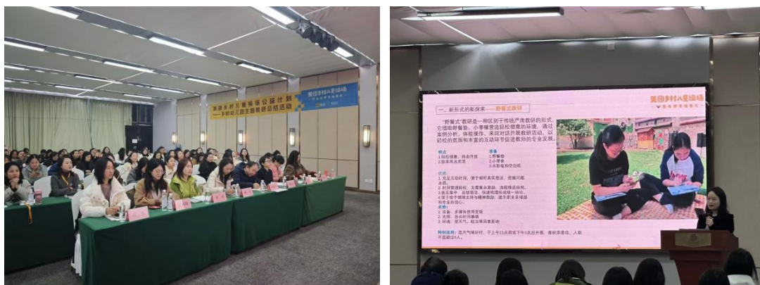
图：11月21日乡村幼儿园主题教研总结会精彩掠影