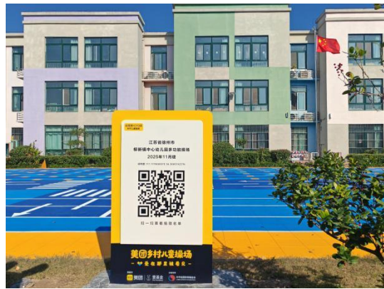
左：科尔沁左翼后旗吉尔嘎朗镇乌苏艾里嘎查幼儿园-铭牌场景照片 右：徐州市柳新镇中心幼儿园-铭牌场景照片