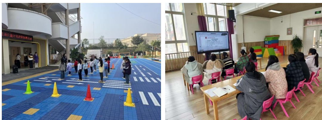
左：11月体育特色示范园线下指导精彩掠影 右：11月19日幼儿软式棒垒球专项线上交流活动精彩掠影