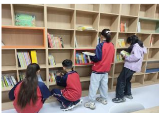
孩子们在图书室阅读