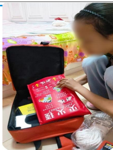
准备家庭应急物资