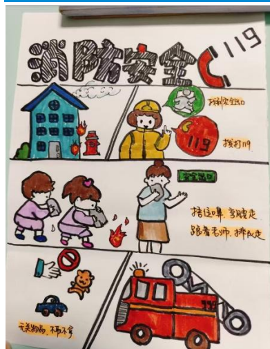
绘制消防安全海报