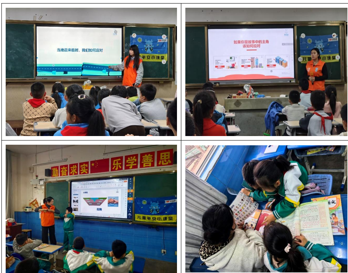
10月，志愿者老师们走进当地学校，为孩子们带去安全教育课程

这样能保障我们的安全。你瞧，咱们穿的校服，晚上被灯光一照，就特别亮，能起到同样的作用呢。”旁边的一位同学说道：“快看，我的书包上也有一小块可以反光的，我们看看还有哪里是具有反光材质的东西。”不一会，大家找到了很多可以反光的物品，例如：鞋子的后面、校服裤子两边的侧缝……一个孩子说道：“这些反光的物品，我们晚上放学的时候带着，都可以保护我们的安全。”