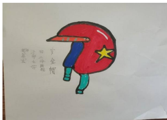
绘制交通安全宣传图