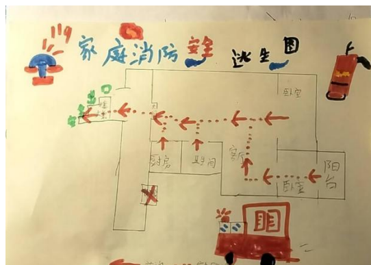
绘制家庭消防逃生路线图