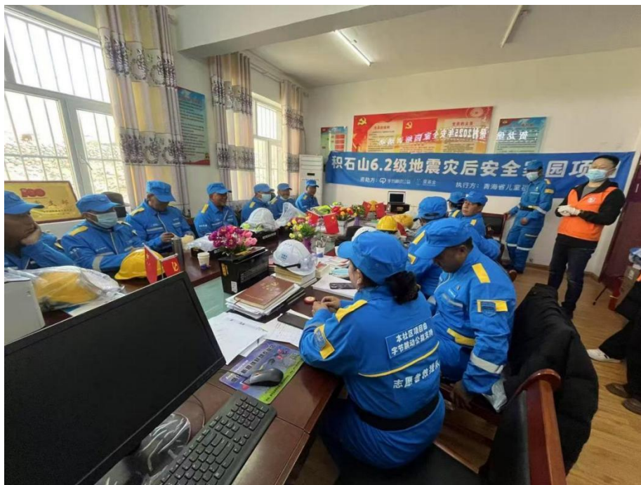
青海省儿童福利协会由教官组织开展社区服务活动