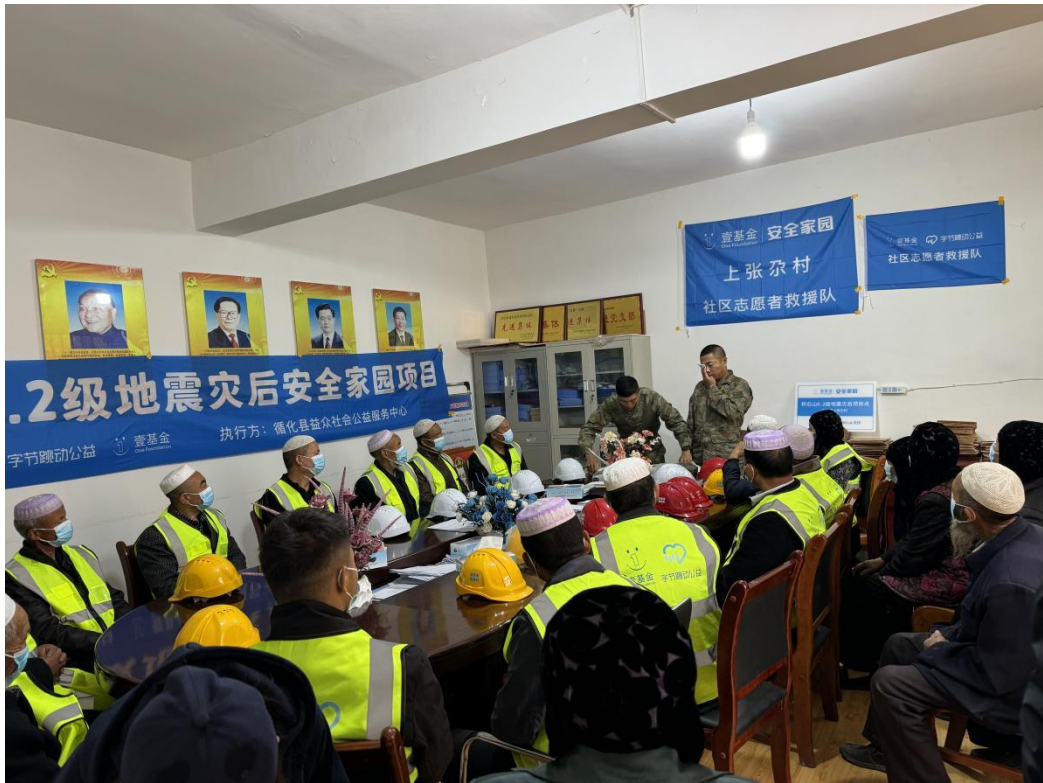
循化县益众社会公益服务中心在上张尕村开展社区防灾减灾活动