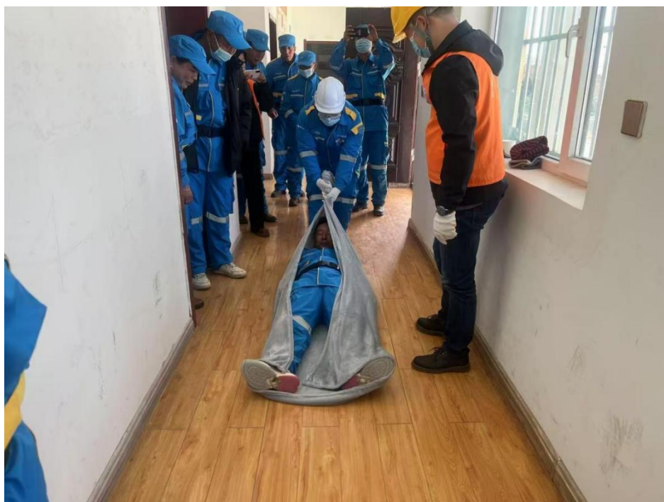
青海省儿童福利协会为村民开展应急技能知识培训