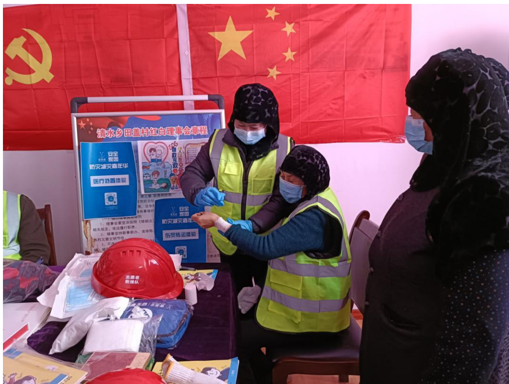
图 1：大通县星月社会工作服务中心在田盖村开展社区嘉年华活动