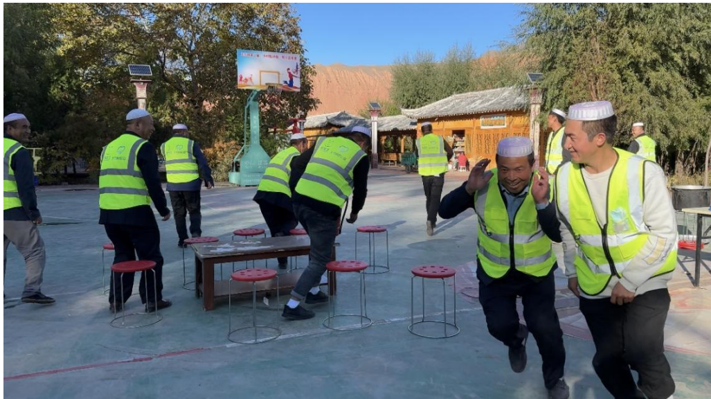
循化县益众社会公益服务中心在上张尕村开展社区防灾减灾活动

3 月份，青海高原红星灾难救援搜救犬训练中心、循化撒拉族自治县社会工作服务中心、大通县星月社会工作服务中心、循化县益众社会公益服务中心等机构分别在乙日亥村、上张尕村、田盖村、红庄村、芒拉村开展社区应急志愿者课程培训 33 个课时。