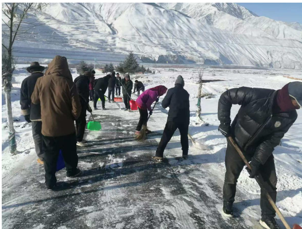
图 2：贺龙堡村救援队队员在内的村民清理乡村道路积雪，保障行人安全

2 月份，青海循化县益众社会公益服务中心分别在循化县上张尕村、乙日亥村 2 个地方开展了活动，参与人数 120 人次，并对活动进行了复盘；同期青海省儿童福利