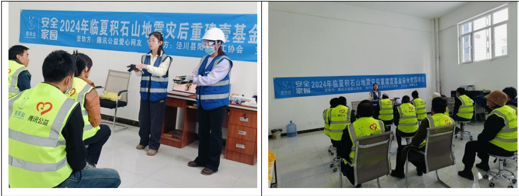
图 4-5 开展项目主题培训

在阿里巴巴公益淘金币专项的支持下，2024 年 12 月期间，在壹基金与阿里巴巴公益淘金币专项的支持下，泾川县阳光义工协会在后阳洼村开展志愿服务活动，志愿者救援队队员们积极行动，全力协助农户顺利搬入新家。