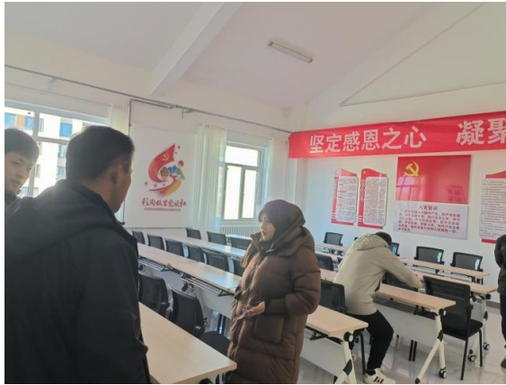
图 3 与康吊村村委对接项目工作

临夏州临聚力爱心公益慈善中心分别与康吊村关门社灾后恢复重建集中安置点、康吊村灾后恢复重建集中安置点（分南北两个地块）、甘河滩村灾后恢复重建集中安置点相关工作人员沟通新村委会物资搬迁及与村委书记对接后续培训事宜，确保项目工作能够有序推进。