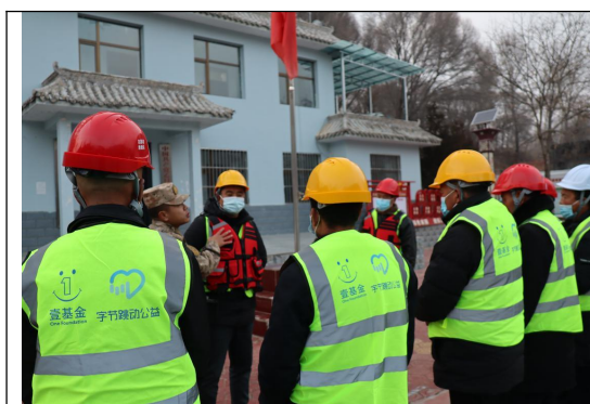
循化撒拉族自治县益众社会公益服务中心由教官

大通回族土族自治县星月社会工作服务中心为两个项目村开展9级-6级应急技能知识培训33个课时。项目教官为2个村志愿者救援队组织开展标准化应急技能培训，支持居民参与制订应急预案，开展应急演练和宣传活动，动员居民学习自救互救技能，以提升社区灾害应对的第一响应能力，参与人数240人。