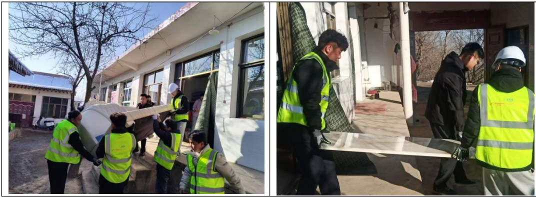
图 6-7 开展志愿服务活动

在阿里巴巴公益淘金币专项的支持下，2024 年 12 月期间，在壹基金与阿里巴巴公益淘金币专项的支持下，泾川县阳光义工协会在后阳洼村开展志愿服务活动，志愿者救援队队员们积极行动，全力协助农户顺利搬入新家。