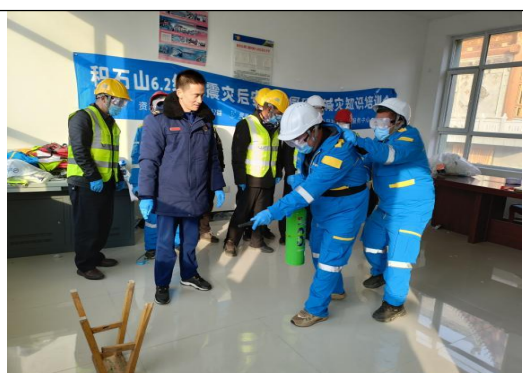
大通回族土族自治县星月社会工作服务中心联合