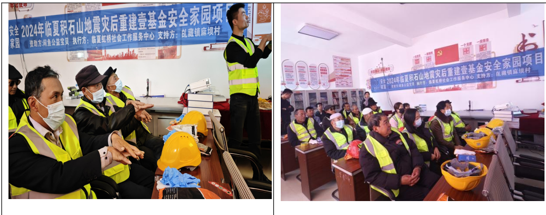
图 8-9 项目活动开展

2024 年 12 月期间，在壹基金与闲鱼公益宝贝的支持下临夏虹桥社会工作服务中心在阴洼滩村、麻坝村、梅坡村灾后恢复重建集中安置点开展项目培训，分别开展了应急指挥、灾难心理、应急预案 1-灾害风险评估等 94 个主题培训，参与培训人员 1937 人次。