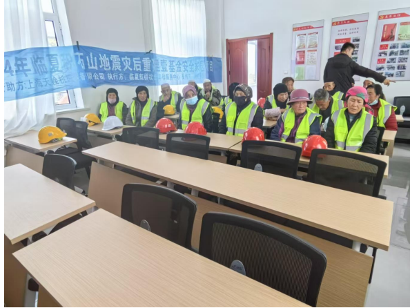
图 10 项目活动开展

2024年12月期间，在壹基金与上海天栓机械设备有限公司的支持下，临夏虹桥社会工作服务中心在唐藏村开展项目培训，开展了社区志愿者救援队制度建设、应急演练、害风险评估、风险治理与风险图绘制等22个主题培训，参与培训人员445人次。