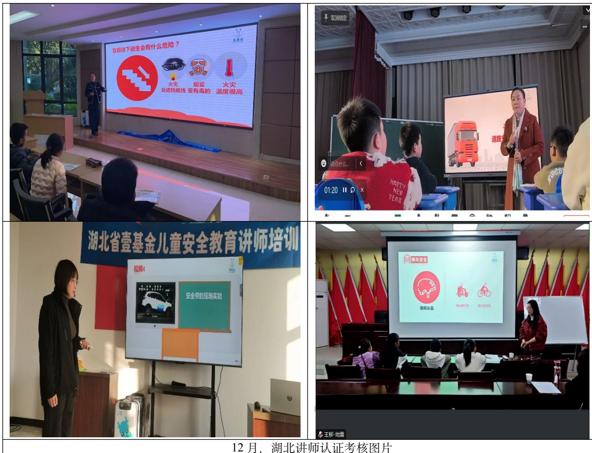
12月，湖北讲师认证考核图片

2024年12月，教务团队在湖北省孝感市组织开展了一场全国安全教育讲师认证考核，共计有77名讲师通过认证，成为壹基金儿童平安小课堂的安全教育认证讲师。