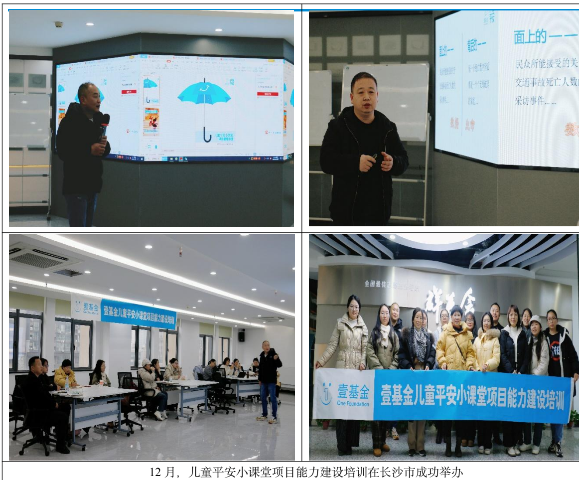
12月，儿童平安小课堂项目能力建设培训在长沙市成功举办

② 12月，湖北省、广东省的伙伴走进了当地的学校，为3-6年级的孩子们带去了134节安全教育课程，共6537人次的儿童从儿童平安小课堂中学习了安全知识和自救互救的技能。宜城三民智慧社会工作服务中心的志愿者老师分享道：在交通安全课堂上，有个女同学说“妈妈每天都接送上学放学，但是却从来不戴安全头盔。经过今天的学习才知道原来不戴安全头盔这么危险。晚上回去要告诉妈妈这些安全知识，还打算拿自己今年的压岁钱给妈妈和自己买一个粉色的安全头盔，让妈妈每天骑车接送自己的时候带。”