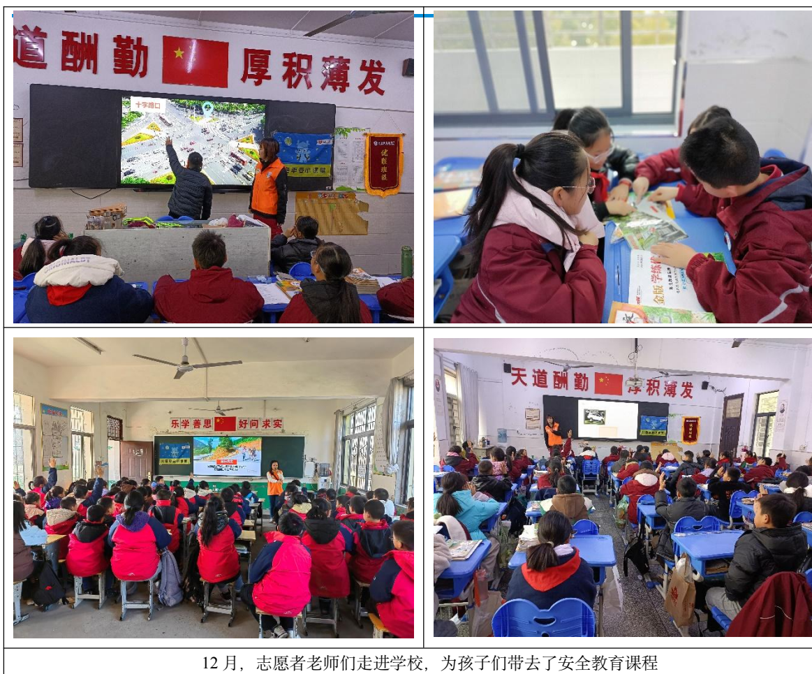
12月，志愿者老师们走进学校，为孩子们带去了安全教育课程