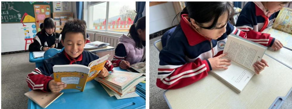
共享读书乐趣，共创美好未来”主题阅读活动