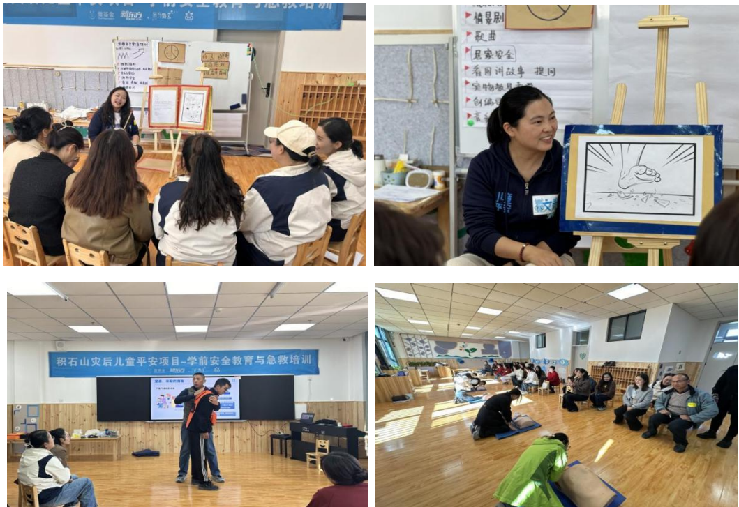
图：学前安全教育与急救培训