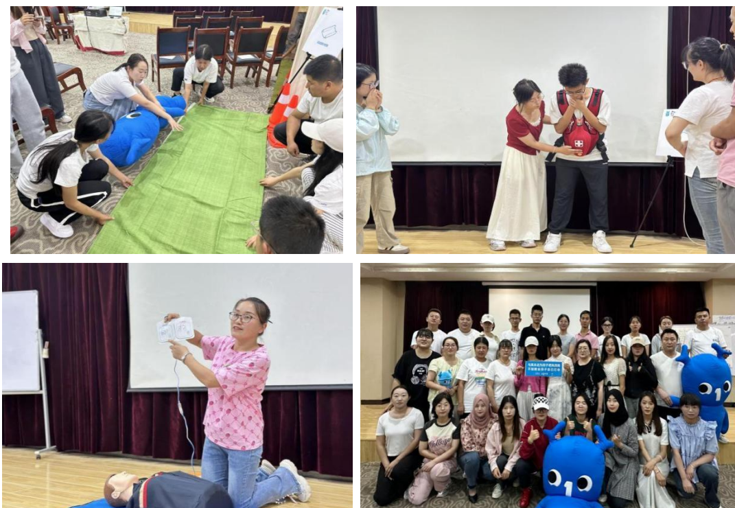
图：生存训练营培训照片