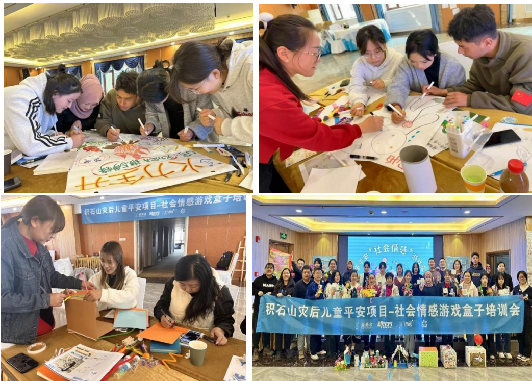
图：社会情感游戏盒子培训