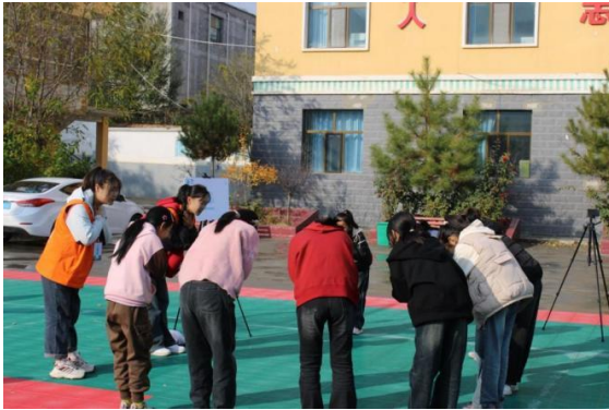
红旗滩小学开展活动-腹部冲击急救法

青海省 6 家社会组织在青海省民和县、循化县共开展了 59 场儿童平安生存训练营活动，761 名志愿者参与其中，共 3954 名儿童从训练营活动中学习了安全知识和自救互救的技能。