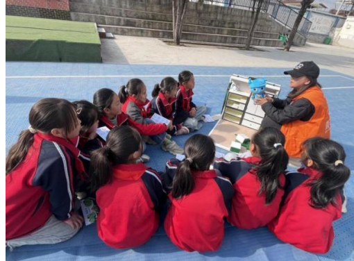
大寺古小学小学开展生存训练营活动-家具防倾倒