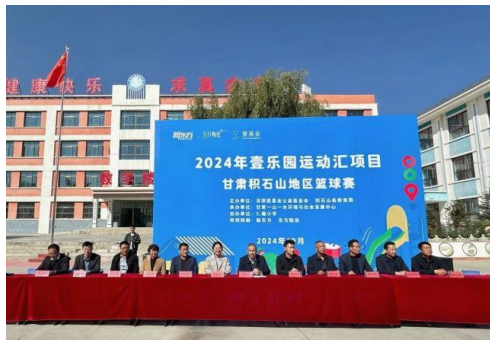
左图：篮球赛启动仪式