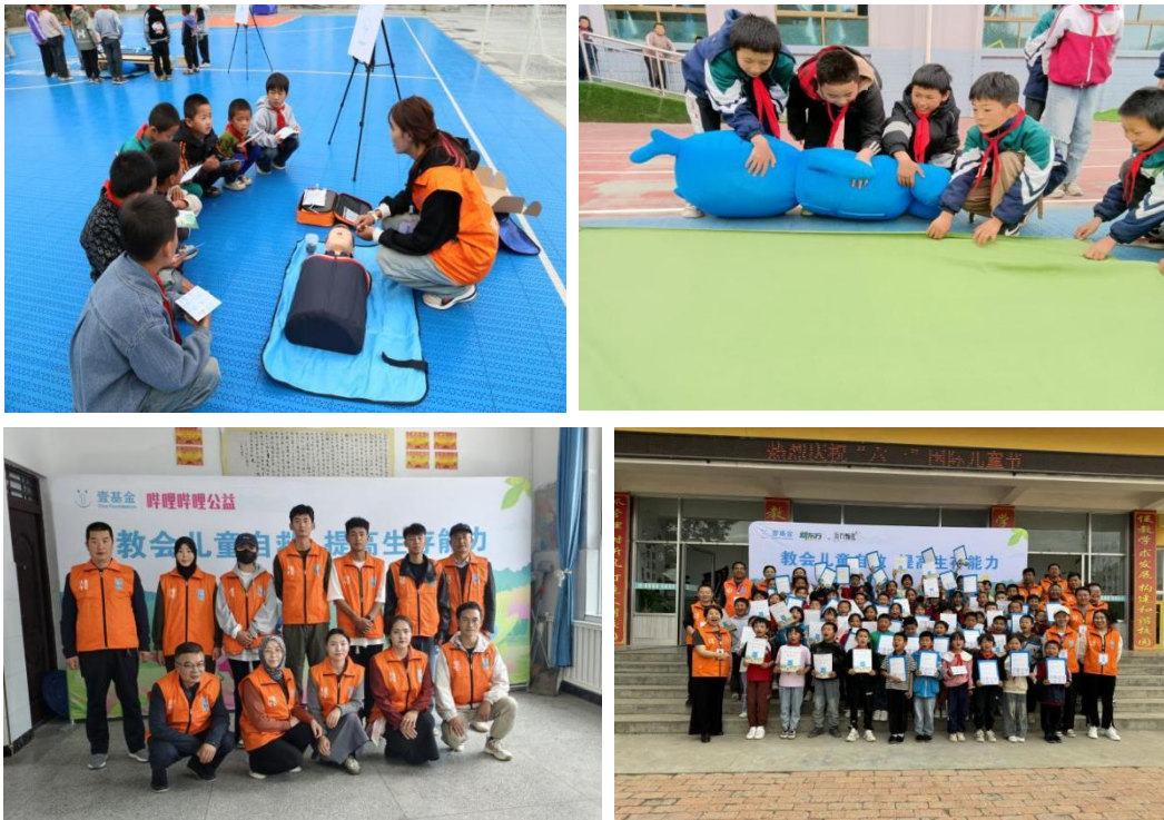
图：生存训练营（甘肃）活动照片