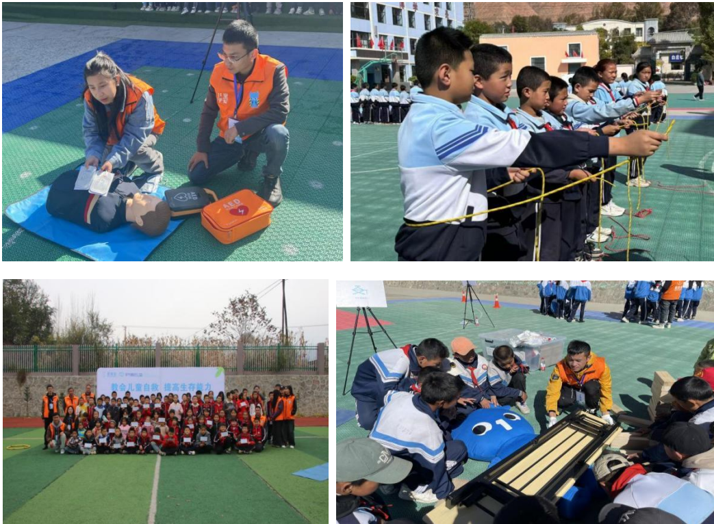
图：生存训练营（甘肃）活动照片