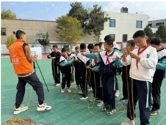
立伦小学开展活动-绳结大比拼