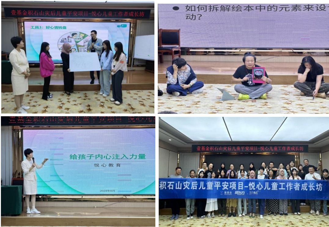
图：灾后儿童平安悦心儿童工作者成长坊