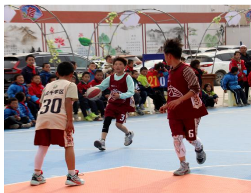
县域篮球联赛现场