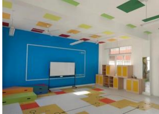
右图：改造后的音乐教室