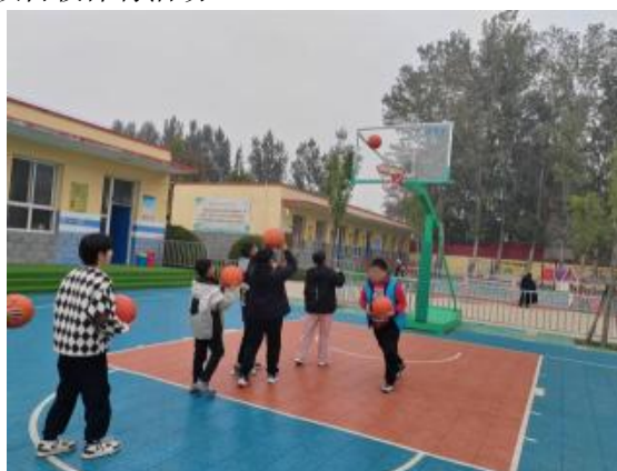
河北定州项目校体育活动