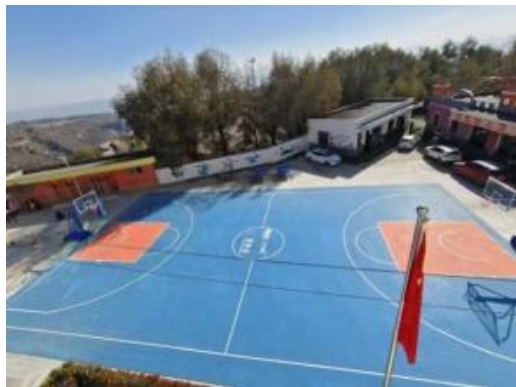
新建成的多功能运动场地

10月，由新东方&东方甄选在甘肃积石山捐赠的【3】座多功能运动场已完成建设。拥有多种运动区域的运动场地能够满足学生不同的运动需求，种类丰富多样器材包增加了运动的多样性和趣味性，大大激发孩子们的运动兴趣。