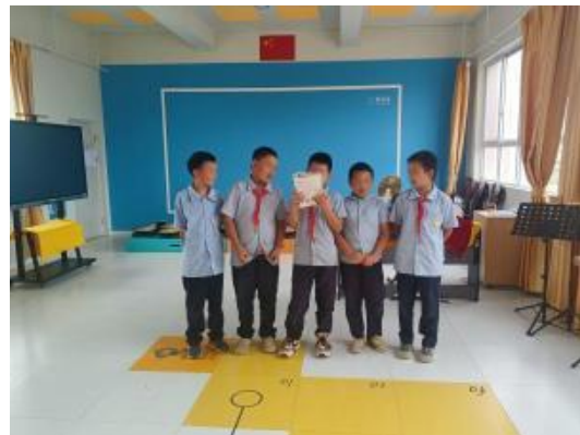
云南弥渡音乐教学课堂