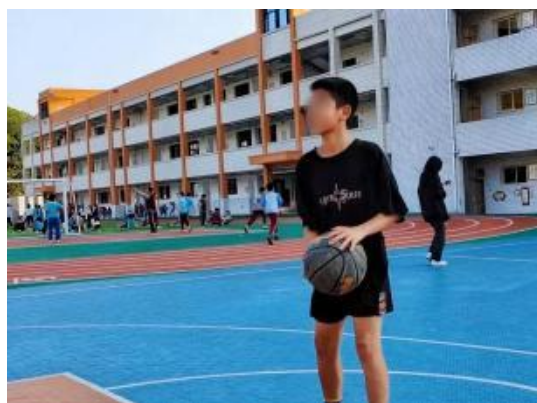
左图：四川自贡项目校体育活动

10月，四川自贡、云南昆明、河北定州等地区共【17】所项目校开展日常体育活动。各项目校的孩子们在丰富多彩的体育活动中锻炼了身体，同时也培养了团队意识和竞争精神，在比赛中相互学习、相互激励，形成了良好的校园体育氛围。