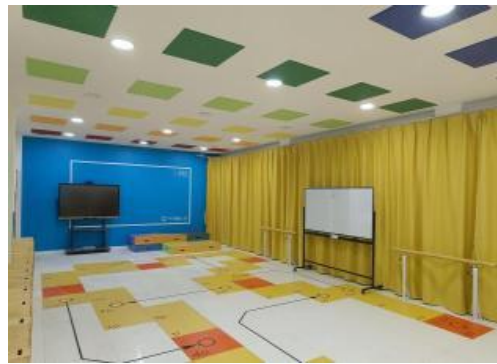
改造后的音乐教室