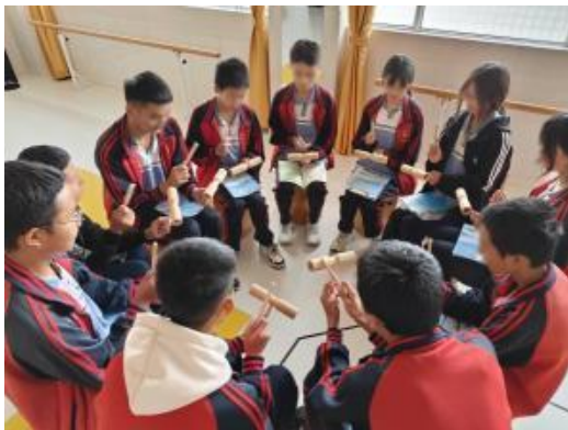
云南弥渡音乐教学课堂

10月，云南弥渡、四川内江等地共【8】所项目校开展【32】场日常音乐教学，孩子们在老师的带领下学习打击乐，感受打击乐的节奏、将打击乐融入合唱并进行分声部练习。每次上音乐课大家对新的打击乐器的学习都特别期待。