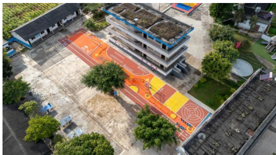
新建成的游乐设施

10月，由睿远公益基金会在云南普洱捐赠的【2】座游乐设施完成施工。目前，2024年度计划的【3】座游乐设施已全部完工。新的游乐设施建成后孩子们特别喜欢，平时只要下课、放学都会在游乐设施上玩耍。同学们使用器材锻炼的时候，还会比比看谁坚持的久。