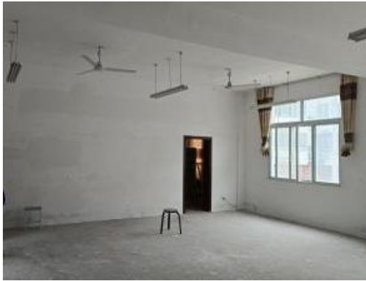
左图：改造前的音乐教室