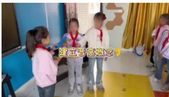
四川内江音乐教学课堂