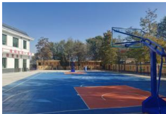
新建成的多功能运动场地