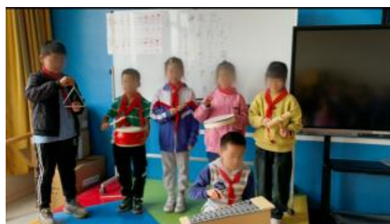
四川内江音乐教学课堂