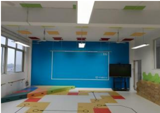
改造后的音乐教室

10月，由字节跳动在四川自贡捐赠的【2】间音乐教室完成改造。焕然一新的音乐教室装备了专业的教学器材和种类丰富的乐器。目前，这两所学校的音乐教室均已正式投入使用，为师生们带来了全新的音乐学习体验。