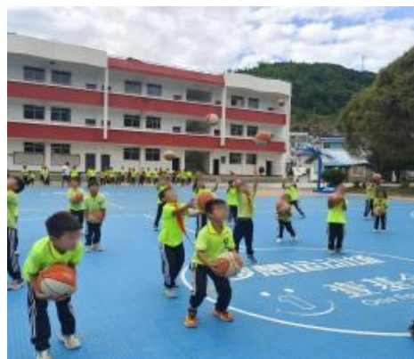
右图：云南昆明项目校体育活动