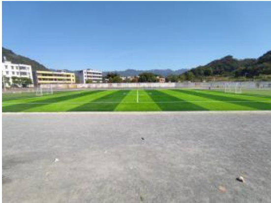
广东英德建成的足球场