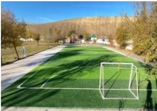
右图：新疆伊犁建成的足球场地