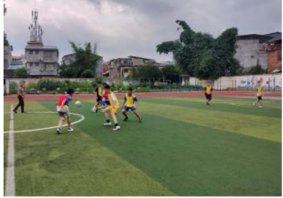
右图：广西马山日常训练