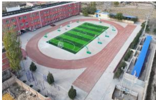
右图：宁夏中卫建成的足球场