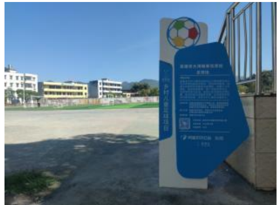
广东英德建成的足球场