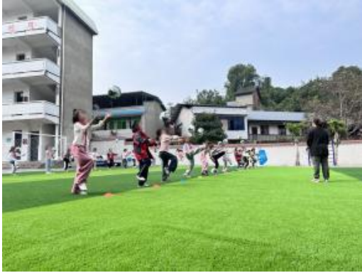
左图：四川自贡日常训练