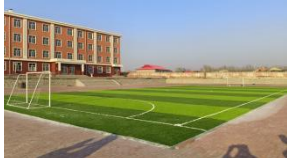
黑龙江大庆建成的足球场