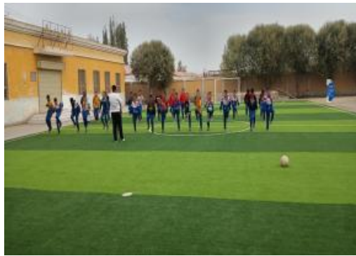
新疆喀什日常训练