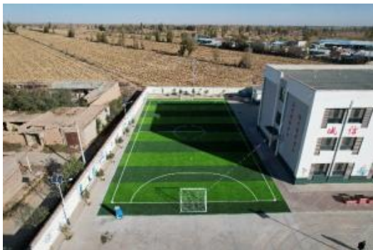
左图：甘肃古浪建成的足球场

10月，由大众汽车集团(中国)在甘肃古浪、宁夏中卫捐赠的【2】座足球场已完成铺设。在新的足球场地里，学生之间的互动性得到了显著提升。他们可以在更广阔的空间里自由奔跑、传球、射门，这种互动不仅增强了他们的团队协作能力，也让他们更加享受运动的乐趣。