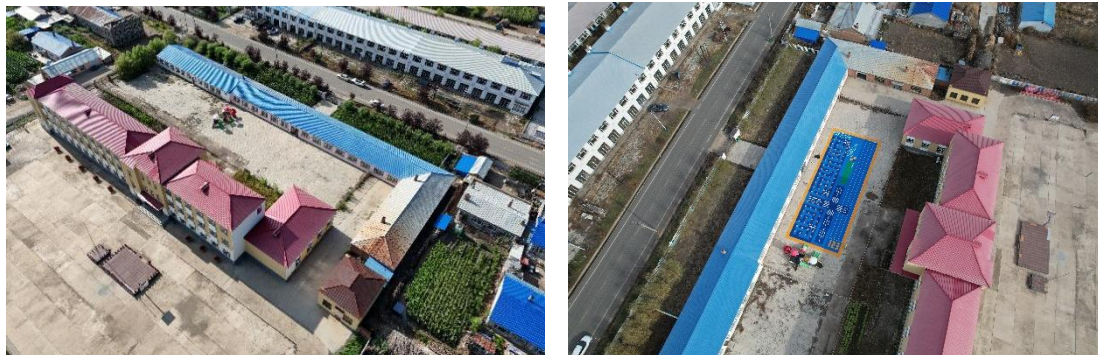
图：克山县发展乡中心幼儿园-铺设前后航拍图