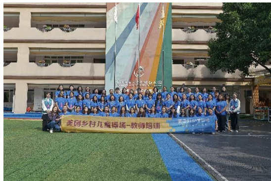
图：10月15日-10月17日成都场教师培训第40、41场精彩掠影