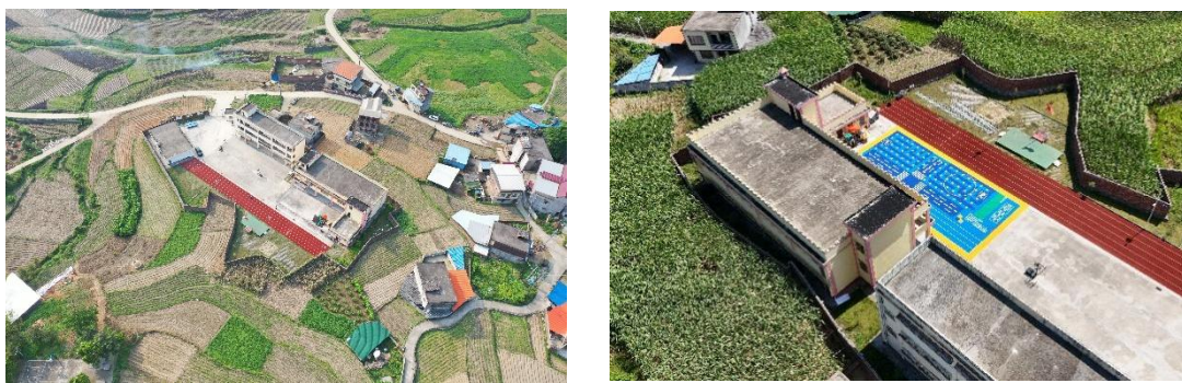
图：柳城县古砦乡独山幼儿园-铺设前后航拍图