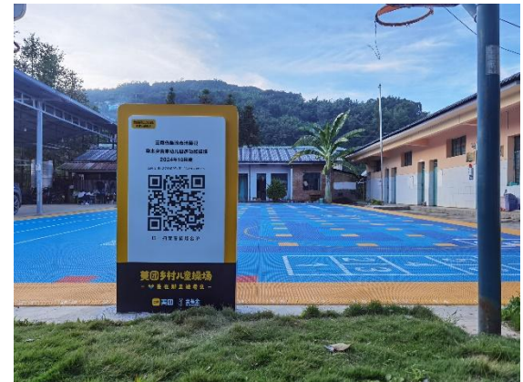
左：竹溪县中峰镇中心幼儿园-铭牌场景照片 右：沧源县勐来乡曼来幼儿园-铭牌场景照片