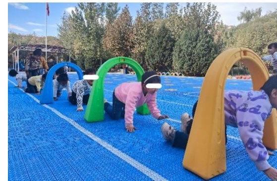
左：桑珠孜区甲措雄乡卡堆村幼儿园-儿童玩耍图 右：疏附县托克扎克镇第二幼儿园-儿童玩耍图