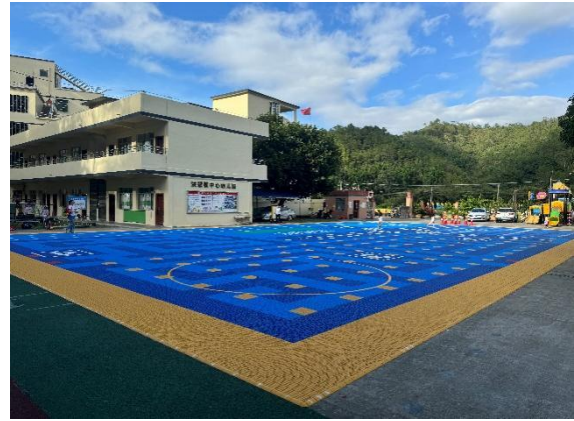
左：静海区梁头镇罗塘幼儿园铺设全景照片 右：信宜市洪冠镇中心幼儿园-铺设全景照片