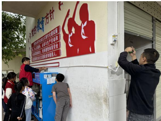
重庆潼南区项目校安装设备，引起了孩子们的围观