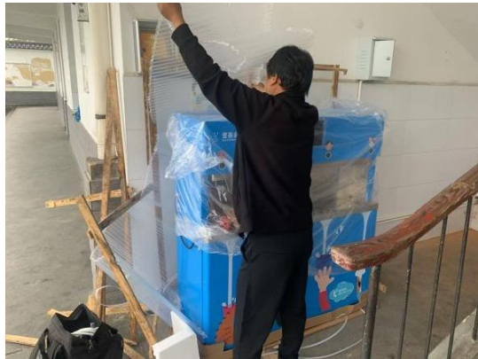
陕西汉阴县项目校安装净水设备