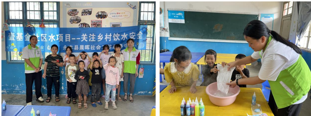
“废水再利用--水宝宝”科学实验活动

直呼太神奇啦！在老师解释了原理之后，孩子们才知道老师倒入的是一包乳酸钙，海藻酸钠与乳酸钙接触时，会发生离子交换反应，就会形成水宝宝的样子。