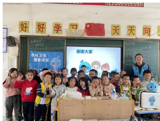
江西永丰县项目校水与健康课堂