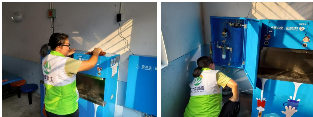
江西永丰县伙伴正在检查净水设备