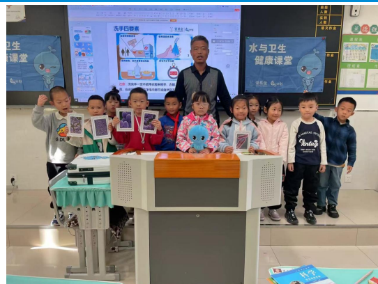
黑龙江肇源县项目校水与健康课堂