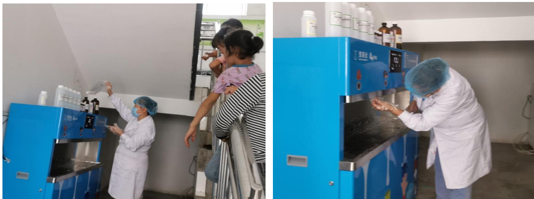
陕西陇县项目校正在取水样

2024年10月，净水计划项目完成27台净水设备的水质检测取样。辽宁辽中区合作伙伴完成了5台净水设备的水质检测取样；甘肃宁县合作伙伴完成了4台净水设备的水质检测取样；陕西陇县合作伙伴完成了2台净水设备的水质检测取样；河南宜阳县、鲁山县合作伙伴完成了10台净水设备的水质检测取样；山东诸城市合作伙伴完成了6台净水设备的水质检测取样；