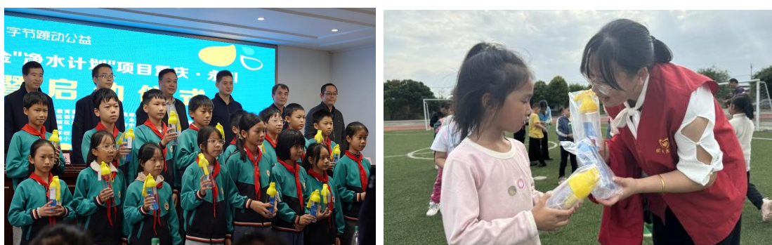
重庆潼南区合作伙伴正在给项目校孩子发放水杯