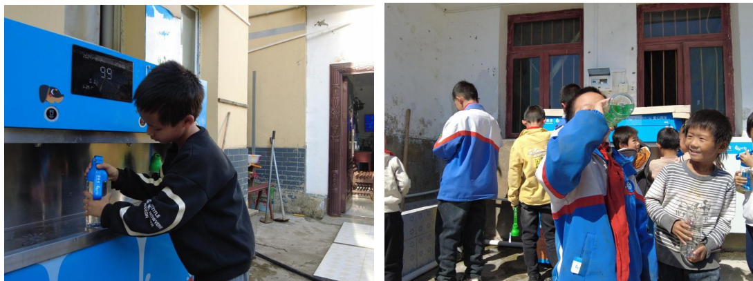
贵州大方县项目校孩子用水杯接水喝