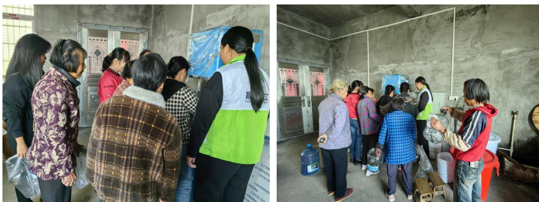
七都乡黄家村发放项目水桶

10月24日江西永丰县合作伙伴在七都乡黄家村为村民发放项目水桶，并带领村民前往净水设备前接取净水，教会村民净水设备的使用方法。