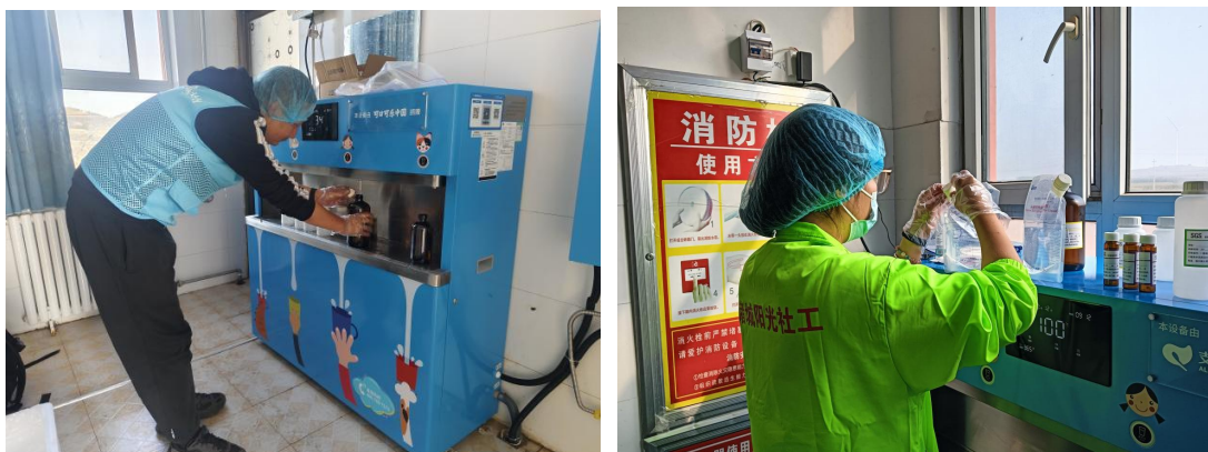
甘肃宁县、山东诸城市项目校正在取水样