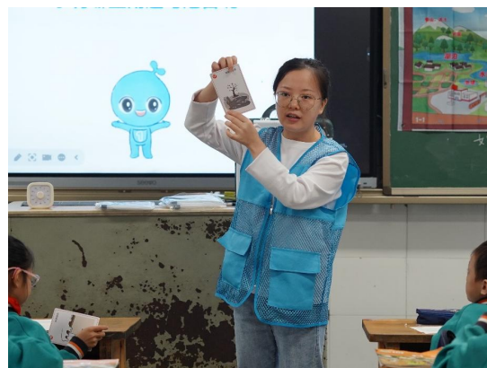
重庆永川区项目校水与健康课堂