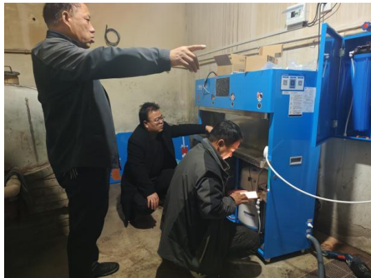
甘肃环县项目校安装净水设备