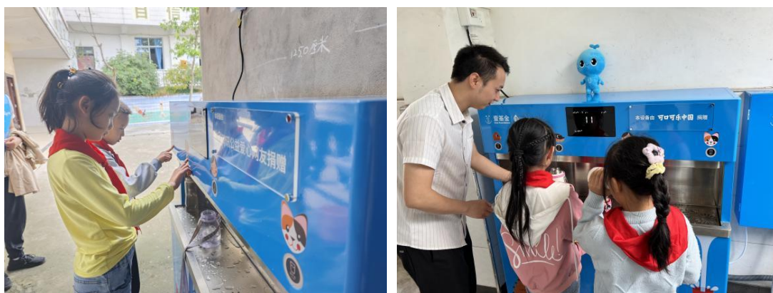
重庆江津区合作伙伴回访项目校，净水设备正常使用