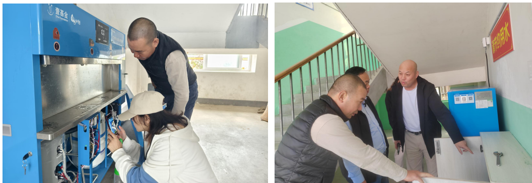
项目校回访，解决物联网异常问题