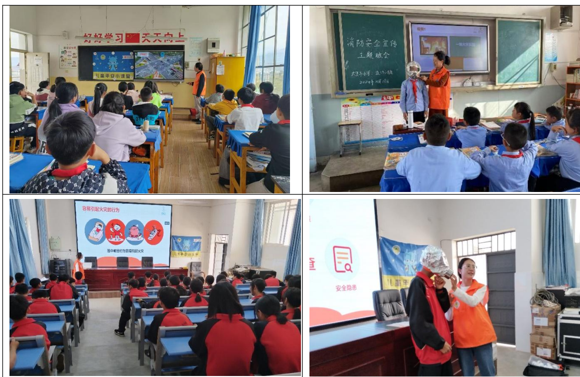
10月，志愿者老师们走进当地学校，为孩子们带去安全教育课程

② 10月，云南省的伙伴走进了当地的学校为3-6年级的孩子们带去了53节安全教育课程，共2669人次的儿童从儿童平安小课堂中学习了安全知识和自救互救的技能。