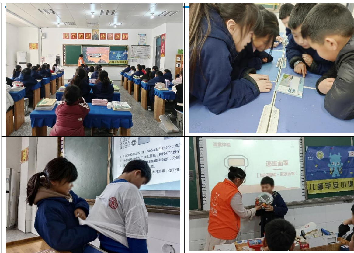
同学们在课堂上制作紧急救生衣（左图），同学在试戴消防面罩（右图）