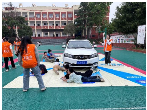
认识车辆视野盲区