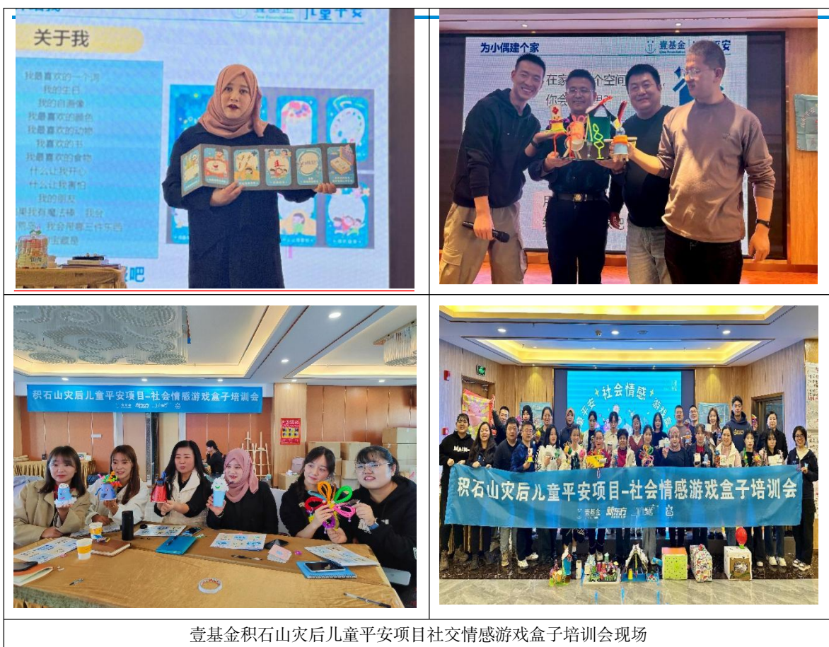
壹基金积石山灾后儿童平安项目社交情感游戏盒子培训会现场