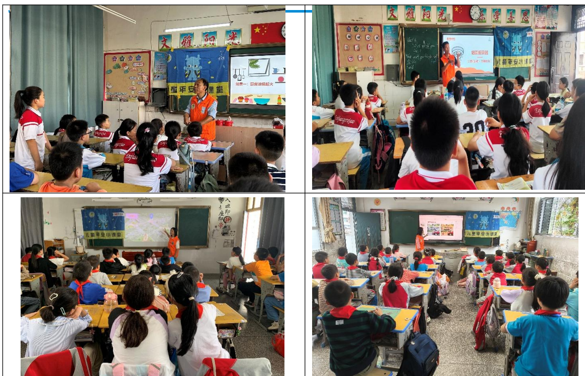
10月，志愿者老师们走进当地学校，为孩子们带去安全教育课程

② 10月，云南省的伙伴走进了当地的学校为3-6年级的孩子们带去了53节安全教育课程，共2669人次的儿童从儿童平安小课堂中学习了安全知识和自救互救的技能。