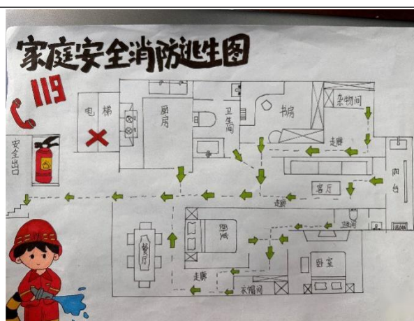
家庭消防安全逃生地图