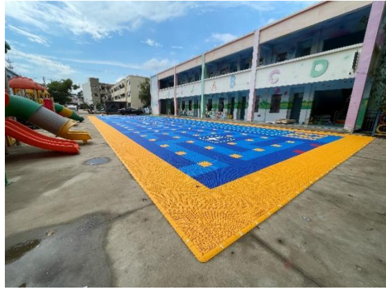
左：平陆县张店中心幼儿园-铺设全景照片 右：泗县山头镇骆庙村幼儿园-铺设全景照片