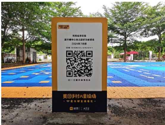
左：平陆县张村镇后地幼儿园-铭牌场景照片 右：定安县黄竹镇中心幼儿园-铭牌场景照片