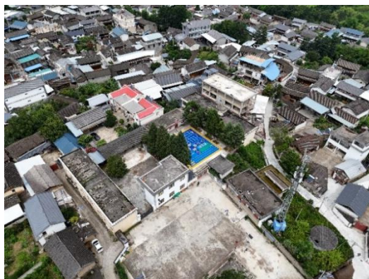
图：香格里拉市上江乡福库村幼儿园-铺设前后航拍图