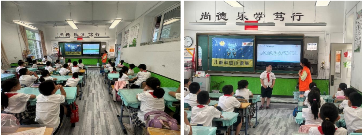
6月24日儿童平安防溺水安全课程走进沈阳市和平区青年大街小学