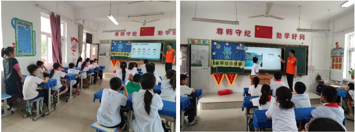
6月4日儿童平安小课堂防溺水安全课程走进范县白衣阁乡中心小学，同学们在课堂上踊跃回答问题