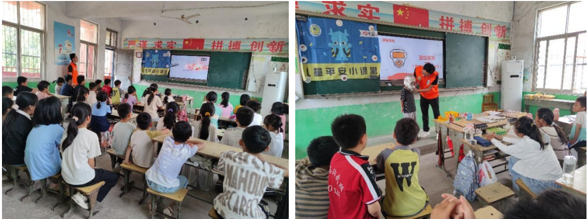
6月19日儿童平安小课堂消防安全课程走进范县白衣阁乡中心小学

② 6月，广东省的伙伴走进了清远市清城区古城小学、梅州市梅县区丽群小学等学校，为3-6年级的孩子们带去了63节安全教育课程，共3258人次的儿童从儿童平安小课堂中学习了安全知识和自救互救的技能。