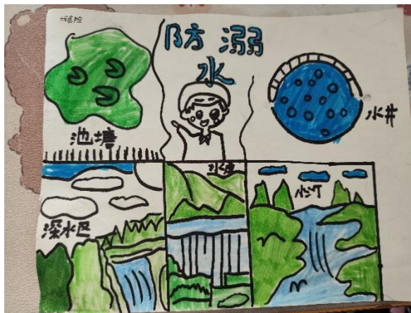
防溺水宣传图 刘玮