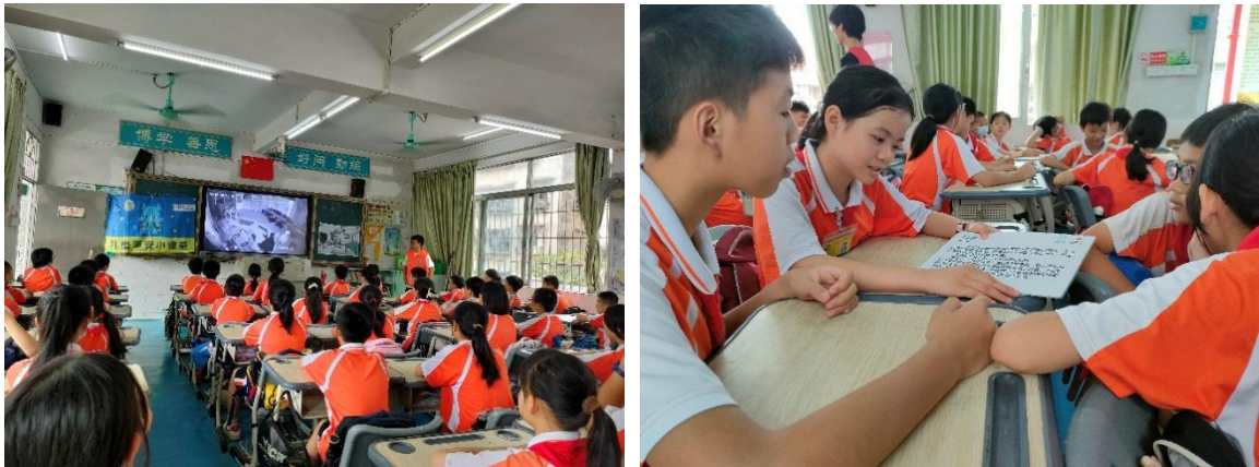
6月19日儿童平安小课堂地震安全课程走进清远市清城区古城小学