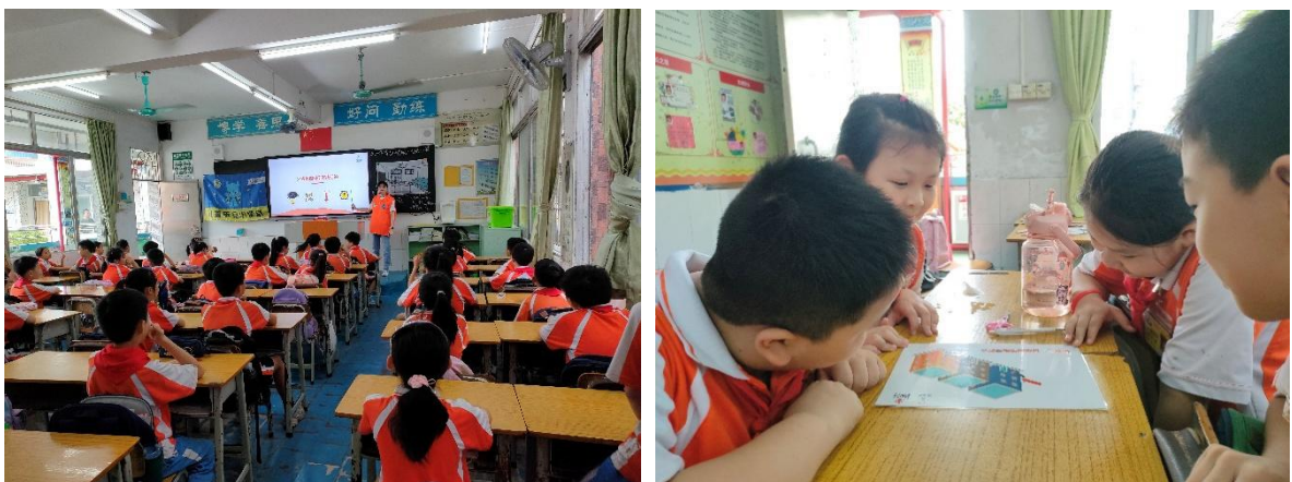
6月19日儿童平安小课堂消防安全课程走进清远市清城区古城小学，同学们在课堂上进行小组讨论

② 6月，广东省的伙伴走进了清远市清城区古城小学、梅州市梅县区丽群小学等学校，为3-6年级的孩子们带去了63节安全教育课程，共3258人次的儿童从儿童平安小课堂中学习了安全知识和自救互救的技能。