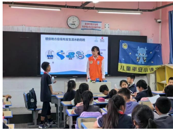
6月13日儿童平安小课堂防溺水安全课程走进二七区京广路小学