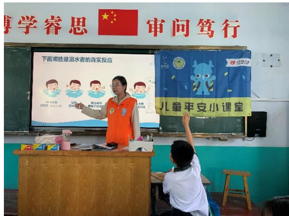
6月19日儿童平安小课堂防溺水安全课程走进诸城市府前街小学