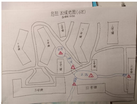
防溺水风险排查地图 张梓朔