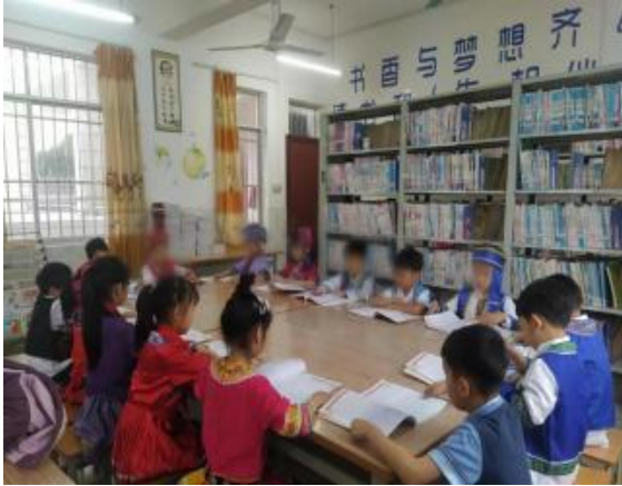
左图：广西马山阅读活动