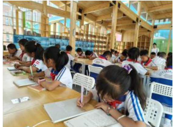
右图：分享阅读心得