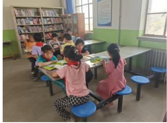
认真阅读的孩子们