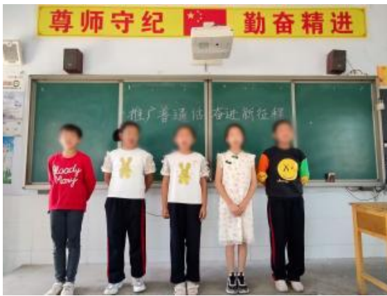
左图：甘肃白银阅读活动

本月，甘肃白银、广东马山、河南开封等地区项目校共开展了【219】场阅读活动。孩子们根据自己的兴趣和选择，在阅读教室里独立阅读。老师始终陪伴在孩子们身边，不时地给予指导和建议。每当孩子们遇到不理解的地方，老师都会耐心解答，帮助他们更好地理解书中的内容。同时，老师还鼓励孩子们在阅读中积极思考，提出自己的见解和疑问，培养他们的批判性思维 and 创新能力。