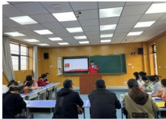
右图：教师阅读交流会