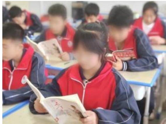
右图：甘肃成县阅读活动