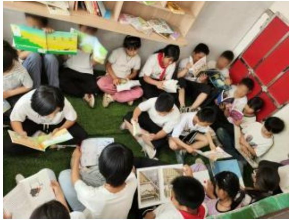
右图：河南开封阅读活动