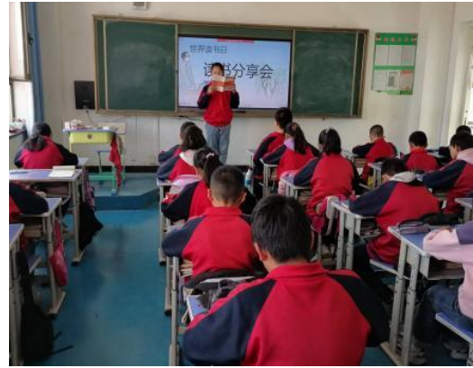
“书香润童心·阅读促成长”读书日活动