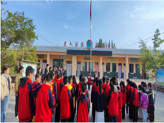
左图：国旗下的演讲

活动。学校老师进行准备了各种丰富多彩的阅读活动：如国旗下的演讲，鼓励同学们在阅读中快乐成长，培养自己的独立思考能力和创新能力。另外，还包括了辩论赛、演讲比赛、读书分享会、与读书有关的相声小品等。同学们踊跃报名并分组参与其中，积极展现自己的才华。