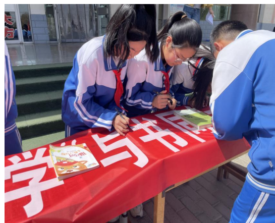
“与书同行，收获满园书香”读书日活动