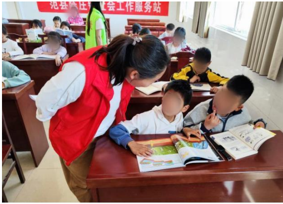
“快乐阅读启迪心灵”读书日活动