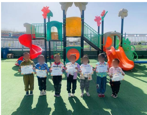
“书香润满园，阅读伴成长”读书月打卡活动