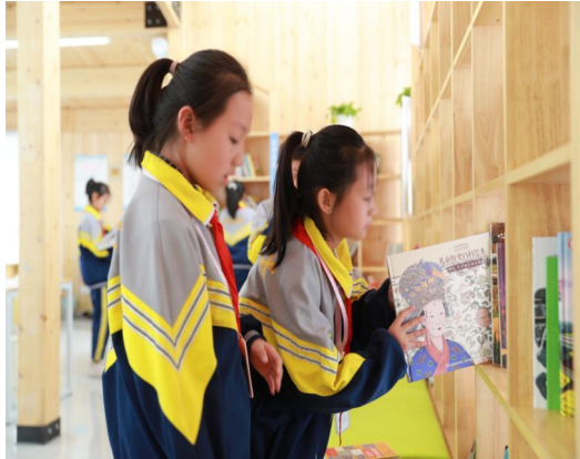
左图：选择兴趣图书