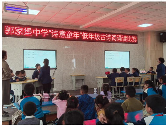
郭家堡中学首届读书日活动