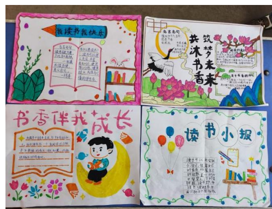
右图：活动成果展示