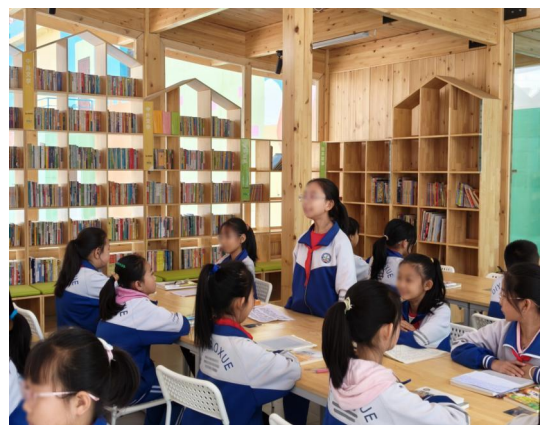
右图：同学们分享读书感悟