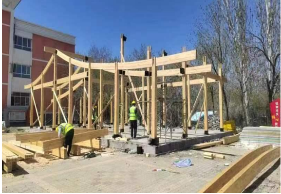
右图：主体框架搭建