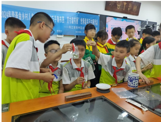
左图：同学们分享制作成品