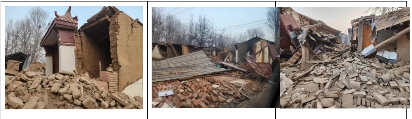
壹基金联合救灾项目甘肃伙伴 12 月 19 日拍摄的陈家村受灾情况

北京时间 2023 年 12 月 18 日 23 点 59 分甘肃临夏州积石山县发生 6.2 级地震，是 2023 年我国发生的最大地震，也是近 9 年来甘肃省发生的最大地震。甘肃积石山 6.2 级地震发生后，习近平总书记高度重视并做出重要指示，李强总理做出批示，张国清副总理于 19 日早率国务院工作组紧急赶赴甘肃、青海地震灾区指导抗震救灾工作。国务院抗震救灾指挥部、应急管理部将国家地震应急响应提升至二级，国家防灾减灾救灾委员会、应急管理部将国家救灾应急响应提升至二级。应急管理部紧急调拨中央救灾物资，紧急启动中央企业应急联动机制、军地抢险救灾协调联动机制和航空救援协调联动机制，统筹调派多方应急救援力量，全力支援抗震救灾。