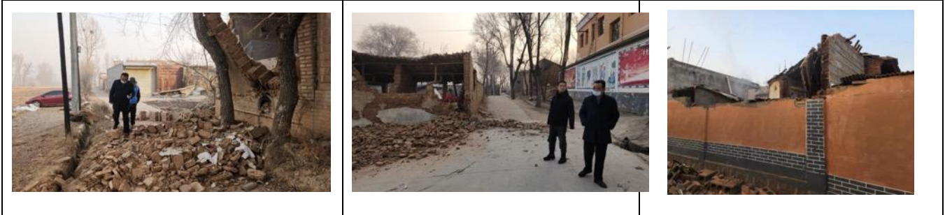
壹基金联合救灾项目甘肃伙伴 12 月 19 日拍摄的韩陕家村受灾情况