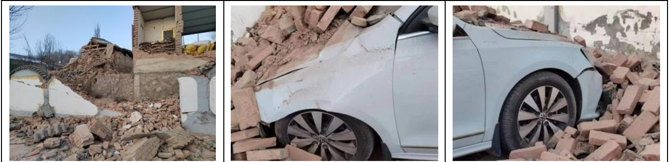
壹基金联合救灾项目志愿者 12 月 19 日拍摄的刘集乡阳洼村受灾情况