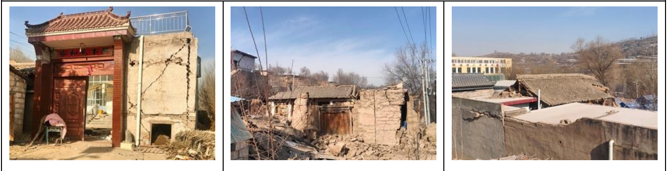
壹基金联合救灾项目志愿者 12 月 19 日拍摄的刘集乡阳洼村受灾情况

应急管理部组织中国地震局派出地震现场工作队，依照《地震现场工作：调查规范》(GB/T 18208.3-2011)、《中国地震烈度表》(GB/T 17742-2020)，对灾区 668 个调查点展开了实地震害调查，确定了此次地震的烈度分布。