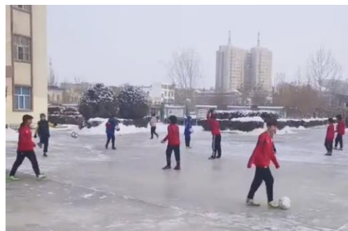
教练带着足球队在未积雪的场地训练