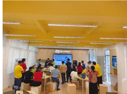
教师参与设备培训