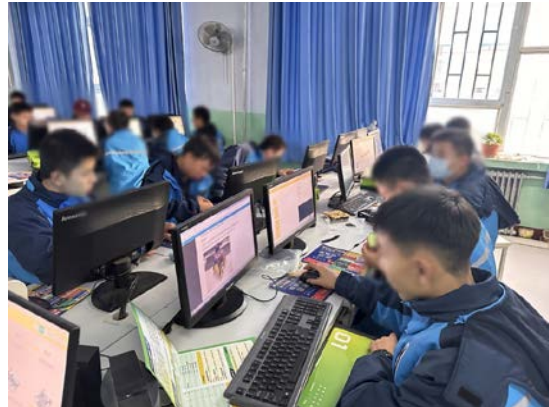
学生们上课和制作作品的过程