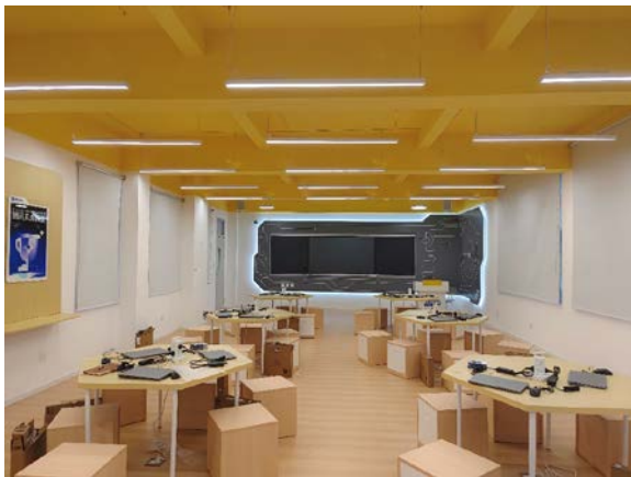
左图：建成的未来教室

11 月，未来教室项目第一批次【5】所学校教室陆续完成验收和交付，为学校老师提供了教室设备培训，保障教师顺利开课，同时，项目组工作人员开展了第二批次项目学校的走访调研工作。