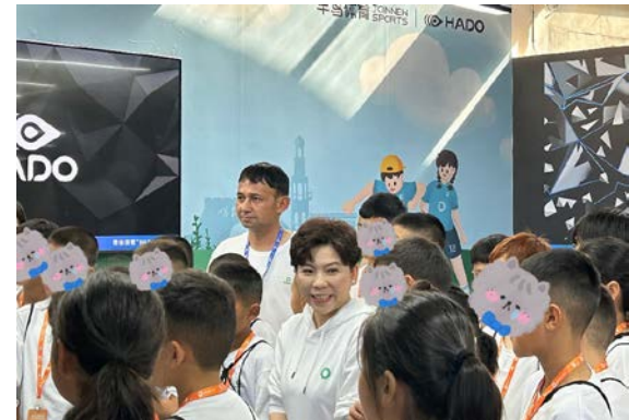
右图：邓亚萍女士陪同学生体验 AR 运动科技