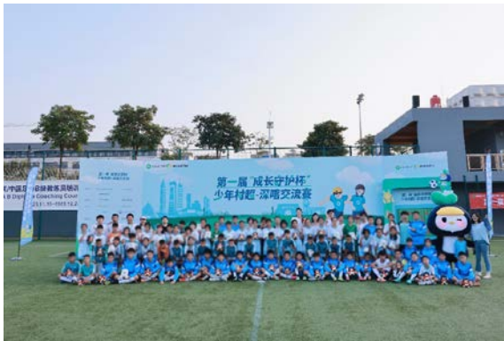
左图：活动人员合照