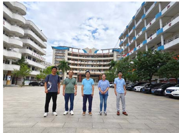
右图：项目组工作人员调研第二批次项目校