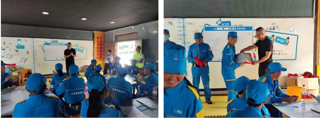
上图：得妥镇项目点开展总结会

11月，德阳市四叶草公益服务发展中心在泸定县得妥镇北头村、南头村、马列村、金光村、椒子坪村、天池山村6个项目点开展了总结会。