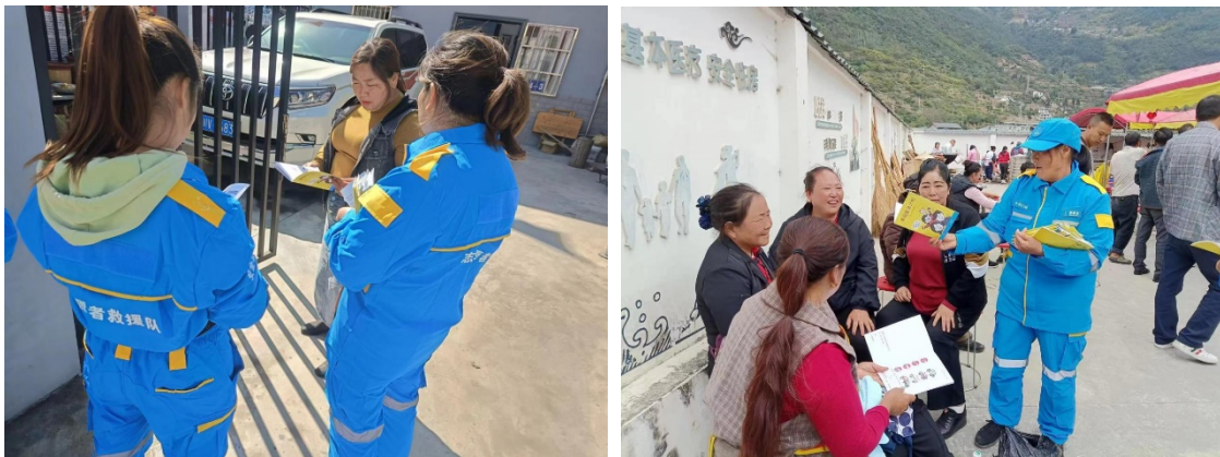
上图：德威镇社区志愿者救援队开展家庭安全计划宣传活动

11 月，北川羌族自治县羌魂防灾减灾研究中心组织德威镇 6 支社区志愿者救援队分别开展家庭安全计划宣传活动。