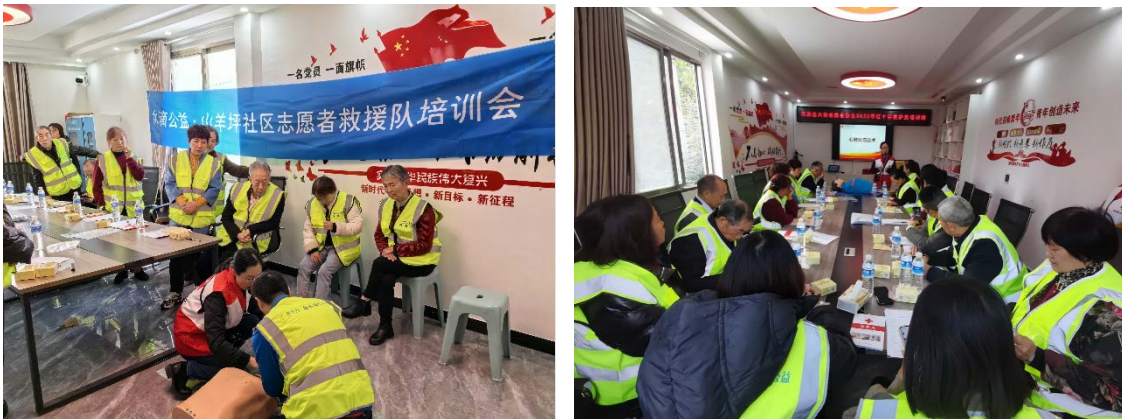
上图：山羊坪社区志愿者救援队开展医疗救护培训

11月，汉源县大树志愿者协会组织山羊坪社区志愿者救援队队员开展了为期两天的医疗救护培训。在培训活动中，汉源县红十字会老师向大家普及了基本的急救知识，通过PPT详细讲解了心肺复苏的概念、操作方法以及流程和特征，对心脏骤停人员意识的判断、检查呼吸、呼救、判断是否有颈动脉搏动、胸外心脏按压、开放气道、人工呼吸等有效操作方法和注意事项进行了生动形象地讲解。演示过后，老师和学员又进行了实操互动体验，手把手、面对面地进行纠正、讲解和操作指导。现场反应热烈，学员们认真观摩聆听，积极参与模拟操作。