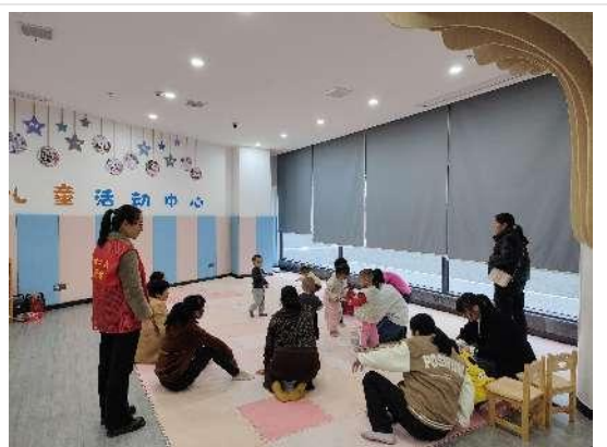
瑞金城市管委会-志愿者老师带小朋友玩手指游戏