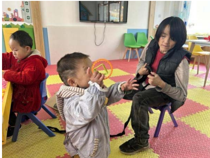
甘肃镇原-妈妈陪妞妞（化名）参与集体活动

大西北的天气真是难以捉摸，呼啸而过的北风吹得人脸疼，远处的山好像瞬间褪去了颜色秃了一片，到处透着清冷，家长们都给孩子都穿上了加绒外套，其中妞妞（化名）单薄的小身板尤为突出。妞妞妈妈有一些生理障碍，为了更好地照看妞妞，她将自己和妞妞用一根绳子绑住。在活动过程中，妞妞显得异常兴奋，总是左抓右挖抢夺小朋友手里的玩具，妞妞妈妈看起来很紧张，她拽着手里的绳子“啊啊啊”的朝妞妞喊了起来，生气的制止着妞妞的举动，不时地比划手势示意妞妞和小伙伴好好相处。妞妞妈妈没有刻意回避大家好奇的目光，每次开展活动，她总是第一个到达现场最后一个离开，虽然她不能像其他家长一样和孩子们互动，但对妞妞的陪伴和爱从不缺席。