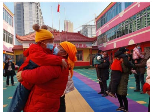
陕西合阳-“爱我你就亲亲我活动现场”

瑞金市壬田镇安排了多种形式的亲子互动游戏、亲子运动，家长们积极参与，与孩子们一起互动，操场上充满了欢声笑语。除此之外，瑞金市城市管委会的两个社区分别开展了亲子早教课，通过手指舞、画圈游戏等方式与孩子们进行互动，教授家长养育知识。