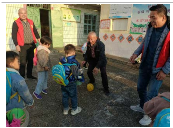
瑞金壬田-家长和孩子们玩皮球