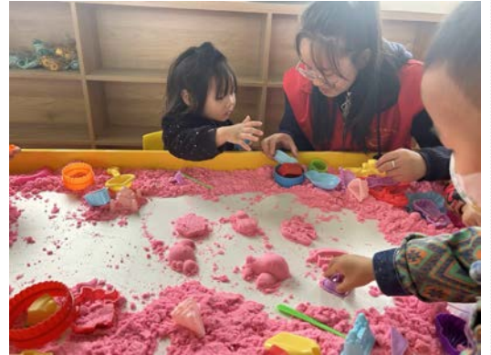
甘肃镇原-志愿者引导孩子玩沙盘

镇原县的志愿者们则带领孩子玩沙盘游戏，利用沙盘玩具教授各种色彩和玩具的基本形状，让孩子们能够充分表达自己的内心世界，促进言语表达能力的发展。