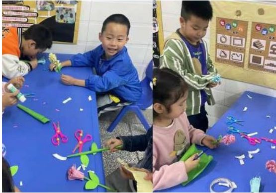
陕西白河-孩子们进行手工制作

为了丰富易地搬迁儿童的社区生活，更快熟悉环境，白河县的志愿者特为搬迁家庭开展了一次手工活动。通过这次活动，孩子们不仅对社区有了新的认识，还结交了很多新朋友，离开时每个孩子脸上都洋溢着快乐的笑容。