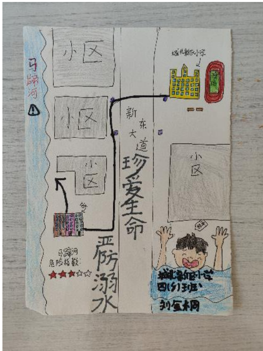
绘制防溺水风险地图 刘子桐 寻乌县城北新区小学