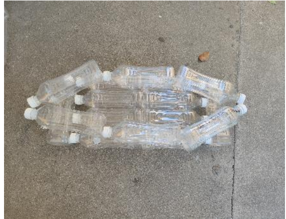
制作防溺水漂浮物 邱心怡 寻乌县城关小学