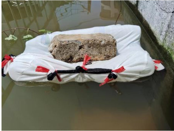
制作防溺水漂浮物 刘梓勋 黄沙中心小学