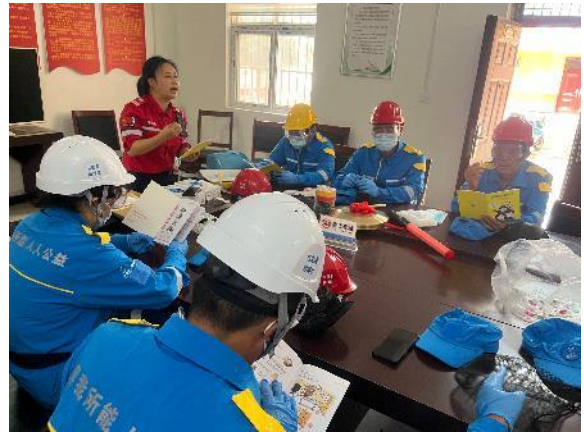
家庭安全计划学习