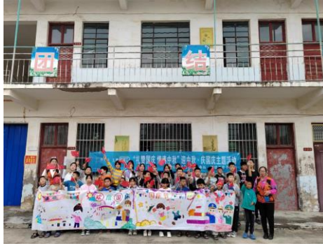
迎中秋·庆国庆绘画活动

2023年7至9月，分布在河南省的15个灾后儿童服务站累计服务0-12岁儿童22,512人次，开展活动达1176场次；参与活动的志愿者达306人次，短视频、公众号等媒体传播453篇。其中，人人课程于开课场次达177场，服务儿童3196人次。