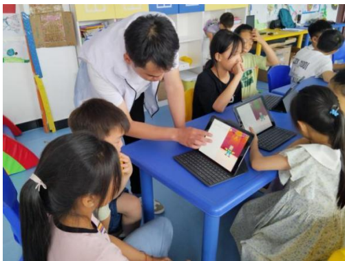
人人课程《小小编舞师》

目前，致力于儿童发展的人人课程上完40节课，其中人人能编程已进行完所有基础语法课程，汉化后的课程内容站点老师反馈较好。针对站点专职的线上支持已进行二十次。