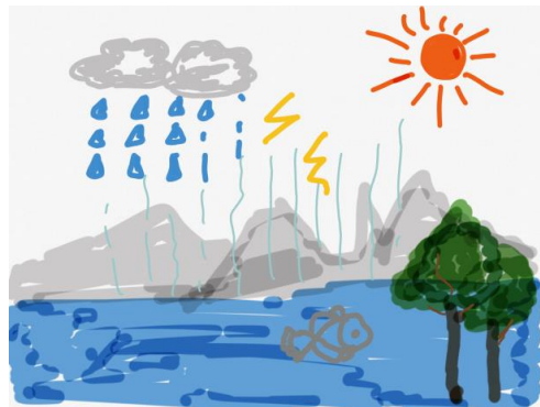
孩子在《自然界的水循环》课堂中绘画的作品