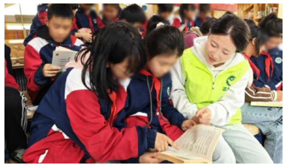
右图：老师和学生互相讨论