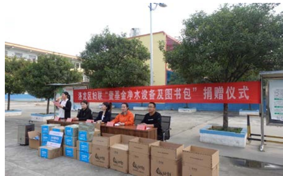
右图：河南洛龙地区捐赠仪式