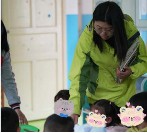
左图：志愿者了解孩子读书情况