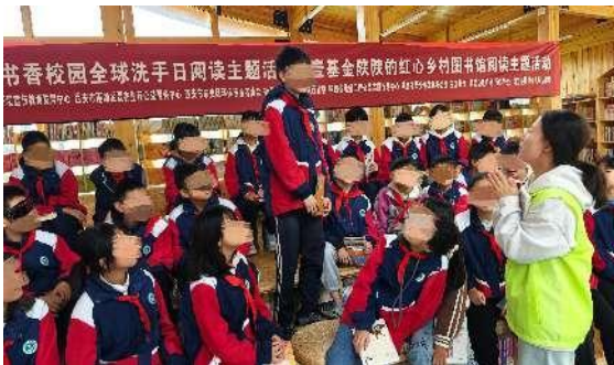
左图：学生积极回答老师问题

10 月 12 日，周至县楼观台镇九年制学校以“手”住健康”“爱粮节粮·传承美德”为主题开展了多场阅读活动。以全球洗手日、世界粮食日为契机，老师向学生们阐述了正确洗手和节约粮食的重要性，引导学生们养成良好的行为习惯，传承中华民族的传统美德。