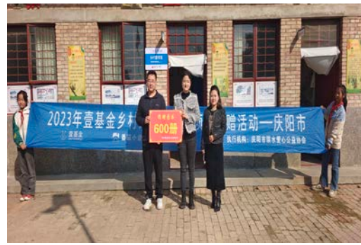
甘肃庆阳地区图书捐赠