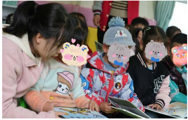
右图：志愿者与孩子们沟通