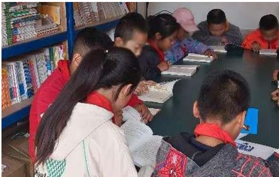
左图：学生们在阅读室内看书