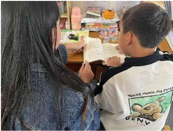
左图：老师陪伴学生阅读