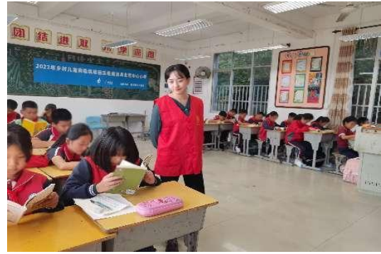
福建地区“书香伴童年”主题阅读活动