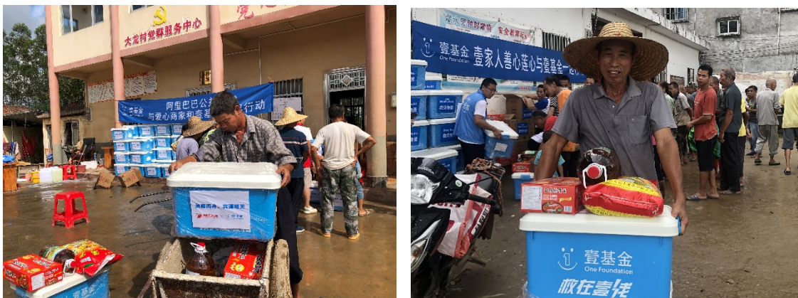
上图：壹基金联合救灾项目广西伙伴为受灾疫情影响的家庭发放物资

壹基金联合救灾项目广西伙伴前往玉林市博白县菱角镇、浪平镇、博白镇等的多个村落，入户了解受灾情况和群众需求后，为玉林市博白县受灾疫情影响的家庭和儿童发放可口可乐饮用水82896瓶、救灾温暖箱376个、夏季温暖包46个、粮油包376套。