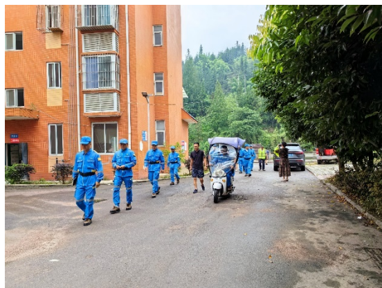
上图：队员在社区协助开展安全隐患排查

本次社区志愿者救援队协助参与社区安全检查工作，累计排查农家了13家、酒店4家、餐饮及公共设施6处，对已经发现的安全隐患处置5处。