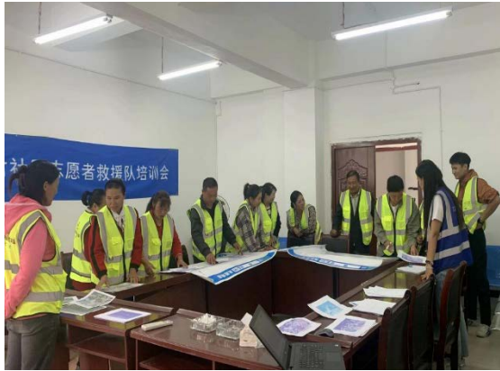
左图：学习应急培训知识