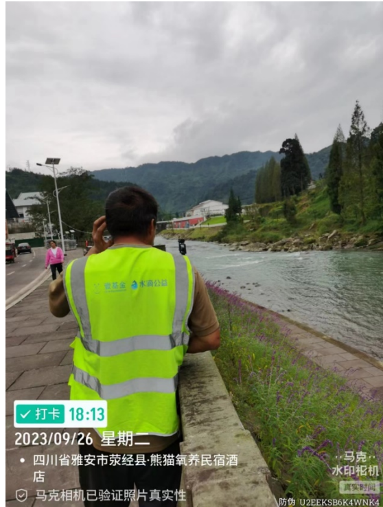
右图：队员在防汛隐患带你检测水位变化

9月7日至26日，万年村安全家园社区志愿者救援队由万年村村委会、龙苍沟镇政府，在万年村组织开展节前社区安全隐患排查工作。