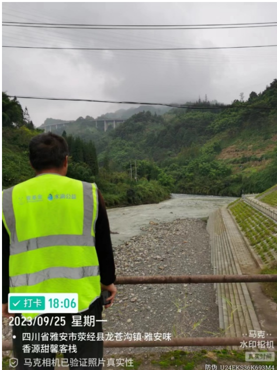
左图：队员对隐患点进行常规巡查

队员 5 人一组，按照防汛部门要求参与日常防汛巡查和值班工作，确保汛期群众生命财产安全。