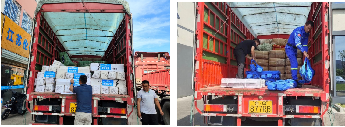
上图：壹基金联合救灾项目江苏伙伴转运物资

壹基金联合救灾项目江苏伙伴迅速启动响应，参与的社会组织 2 家，向宿迁市宿豫区发放可口可乐饮用水 24000 瓶、睡袋 1200 个、折叠床 150 张。