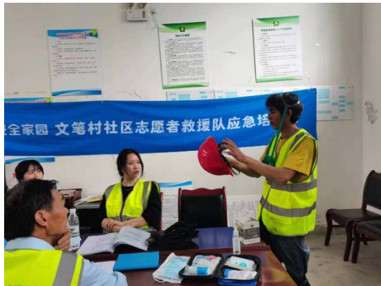
左图：防护佩戴讲解

9月，汉源县大树志愿者协会组织救援队及志愿者到文笔村进行应急搜救演练，邀请搜救队的专业人士，为队员们讲解搜救前应该注意的问题，搜救装备如何正确佩戴、人员转移的方法等内容。