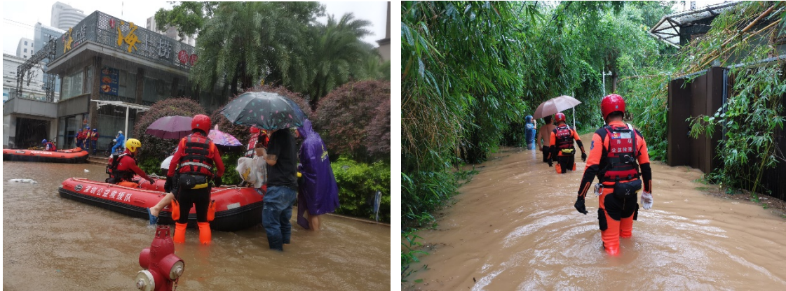
上图：壹基金联合救灾项目广东伙伴转移被困人员

壹基金合作伙伴深圳公益救援队99人备勤，并连夜出发前往龙岗区、福田区、罗湖区开展救援行动，在医院等重点区域协助转移被困人员。截至8日上午12:05，转移群众345人次，其中包括5名危重病人、3名残障人士，清理障碍1处、响应车辆救援3起。