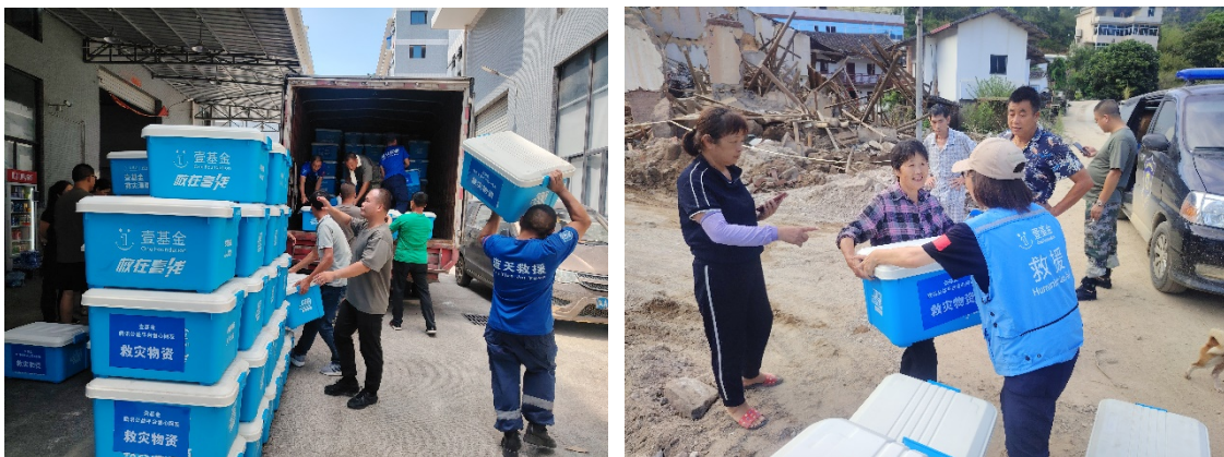
上图：壹基金联合救灾项目福建伙伴转运及发放救灾温暖箱

9月6日18时，壹基金启动救灾响应。壹基金联合救灾项目福建伙伴前往永泰县，在当地政府指导协调下开展紧急救灾行动，向福州市永泰县受灾情影响的家庭发放可口可乐饮用水 75240 瓶、救灾温暖箱 190 个、粮油包 330 套。