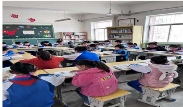
左图：“书香溢校园，经典润人生”活动