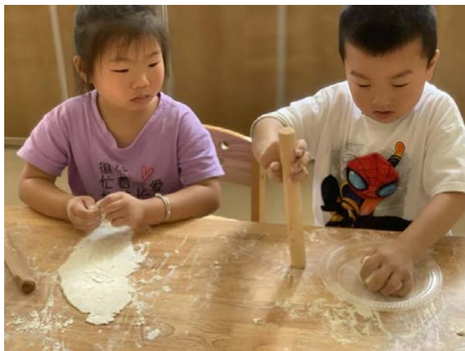
从江县美娥社区 - 搓汤圆