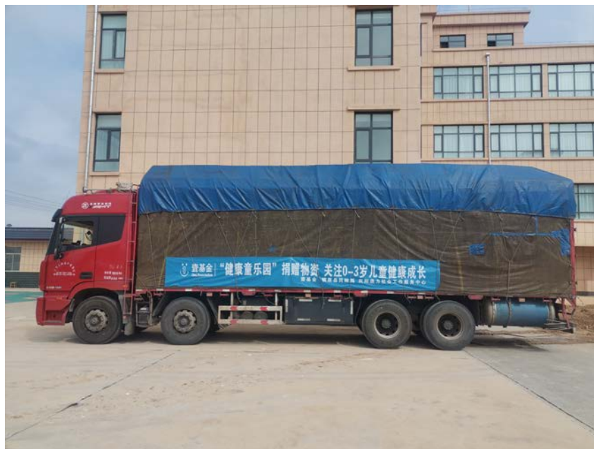
甘肃镇原县——物资运抵项目地