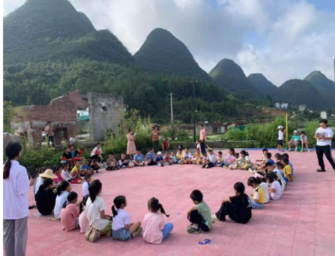
荔波县洪江村——“探索大自然”活动