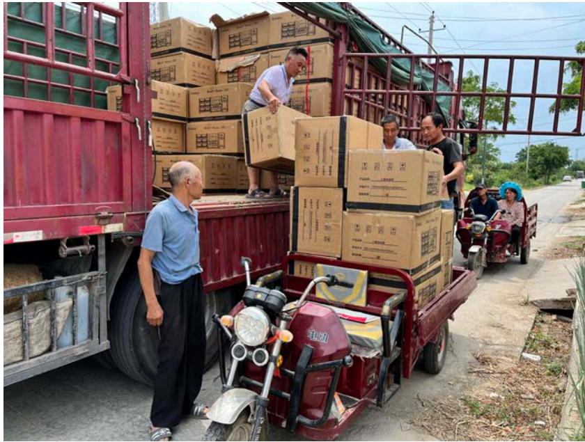
陕西临渭区——村民志愿者协助物资卸车