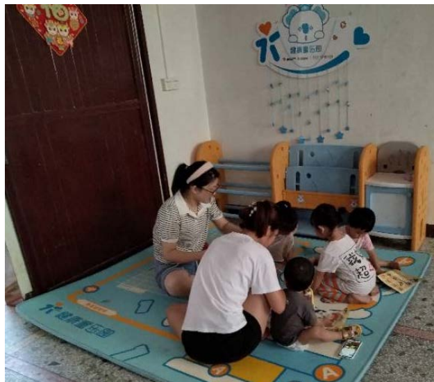
翁源县贵联村——“让我们和孩子画画”游戏

翁源县贵联村举办的“让我们和孩子画画”活动氛围温馨。活动中家长充分尊重幼儿意愿，让孩子们自主探索，孩子们渐渐地忘记了胆怯与陌生。此次活动不仅培养了幼儿的绘画兴趣，还增进了亲子关系。