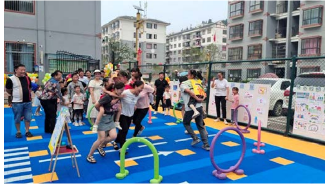
从江县广龙社区——“揪尾巴”游戏

从江县广龙社区举办了“揪尾巴”游戏，孩子欢声笑语不断，亲子共同运动不仅能增加孩子的幸福感，还能锻炼亲子默契，增进亲子关系。