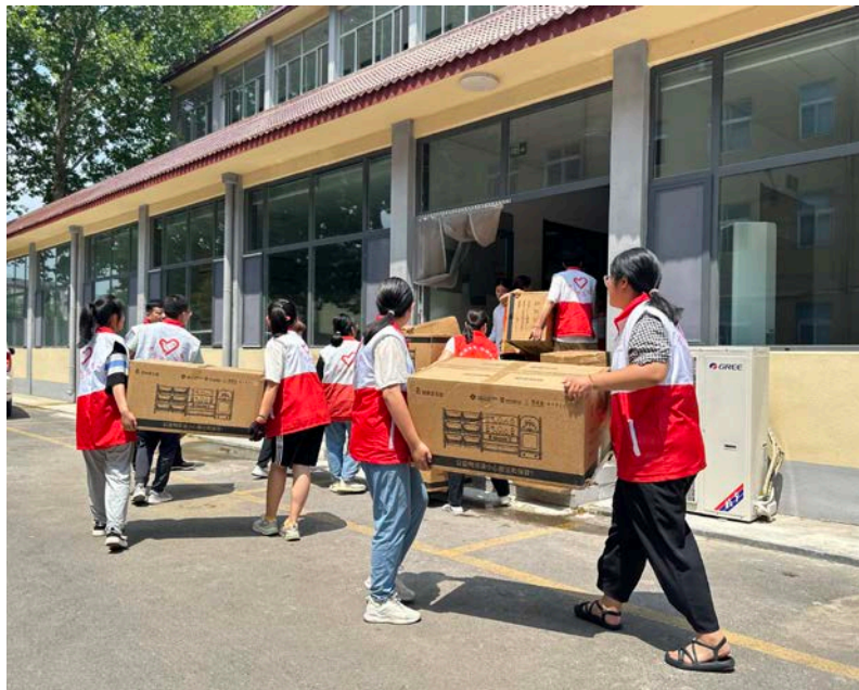
山东青州市——志愿者搬运物资

7月，【1350】套儿童早期发展物资包运抵2023年第一批新项目县，将在山东青州市、甘肃镇原县和陕西合阳县、白河县、临渭区的1350个家庭中搭建起家庭亲子小乐园，并配合后续的社区活动、入户督导等项目活动改善当地儿童早期发展环境，给孩子一个健康、快乐的童年。