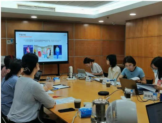
左图：温暖包棉衣供应商进行述标

2023 年 6 月 5 日至 6 月 6 日，壹基金温暖包物资采购小组组织开展棉服、棉鞋、书包的竞争性磋商采购会议，由壹基金、外部专家、月捐人代表组成此次会议的评审团。评审团根据供应商的述标情况、样品材质、现场问答等情况，结合基础资质、样品指标（技术指标）、保障方案、报价四个维度对供应商进行评选，最终评选出 7 家供应商。