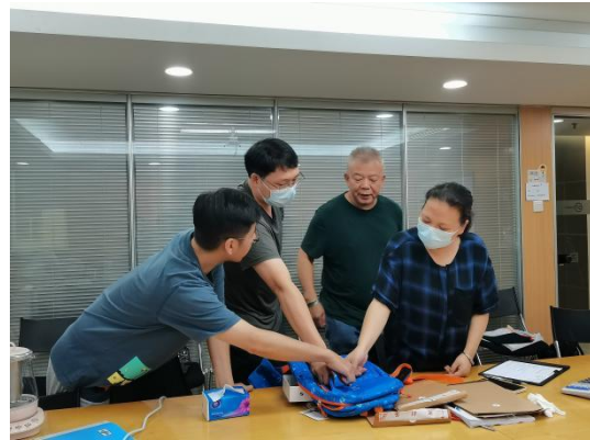
右图：温暖包采购评审团针对书包样品进行防水测试