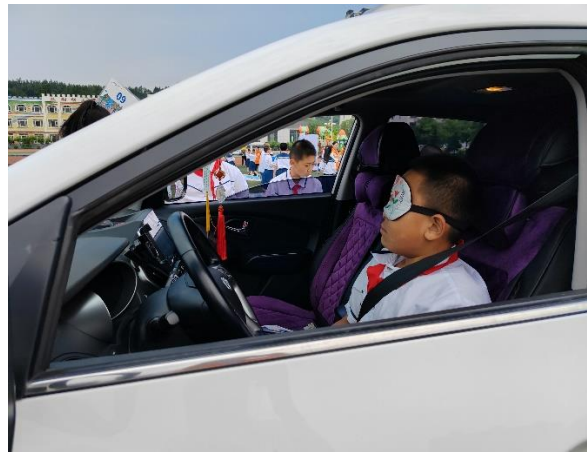
胜利小学 认识车辆盲区