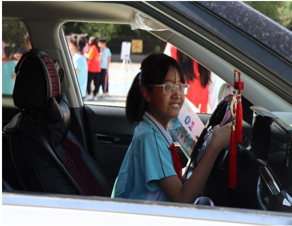
离石区城东小学 认识车辆视野盲区

6 月，六盘水市中和社会工作服务中心、黔西南州中和社会工作服务中心等 14 家机构开展了 54 场儿童平安交通安全训练营活动，为 3992 名儿童带去了安全知识和自救互救的技能。