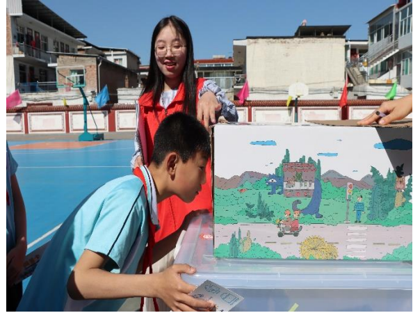
离石区城东小学 探索神奇的盒子