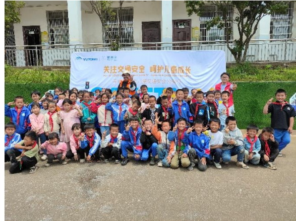
钟山区木果镇蒿枝学校合影