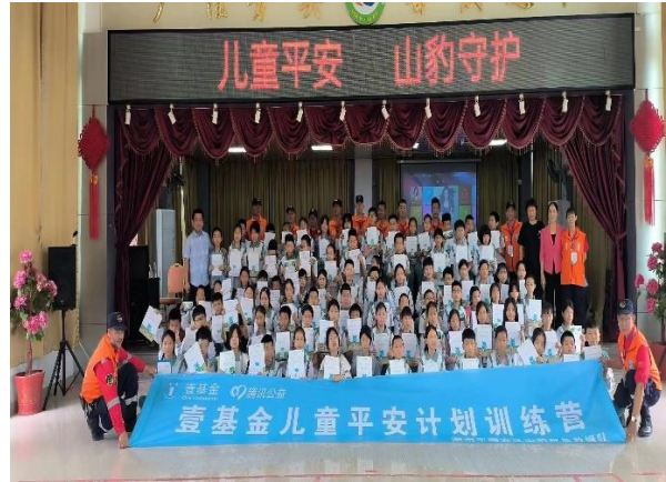
潮安区沙溪镇前一小学合影