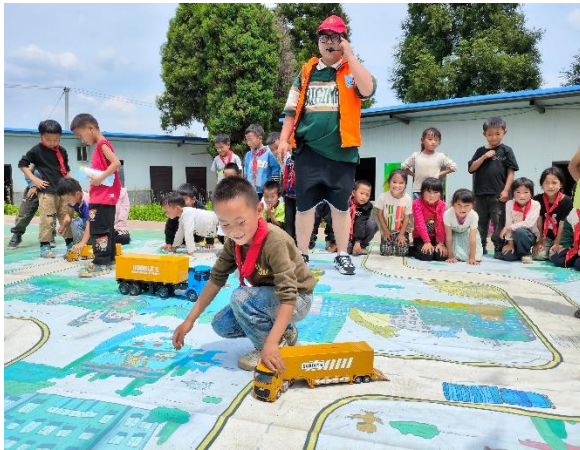
钟山区木果镇三家寨小学 认识车辆内轮差