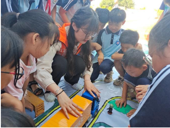
麻兰小学 认识车辆内轮差