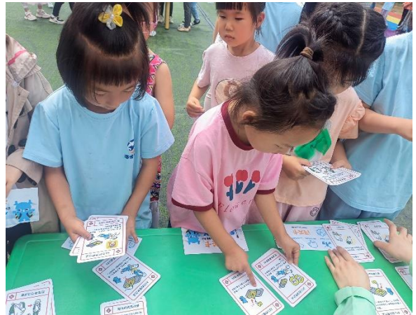
合肥经济技术开发区方兴居委会 排排序