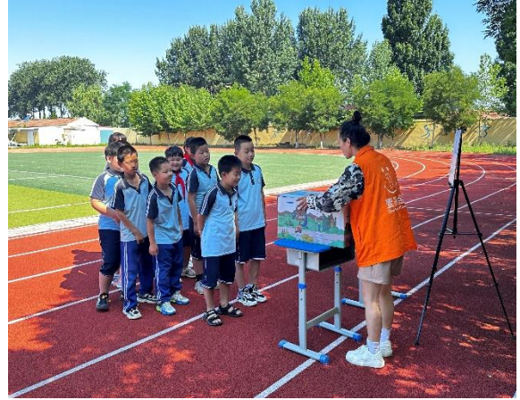
麻兰小学 探索神奇的盒子