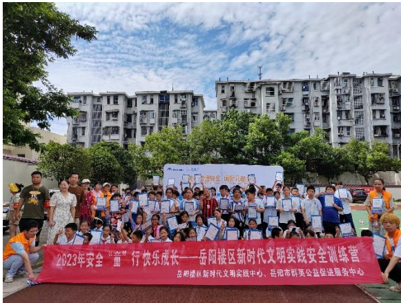
岳阳楼区旭日小学合影