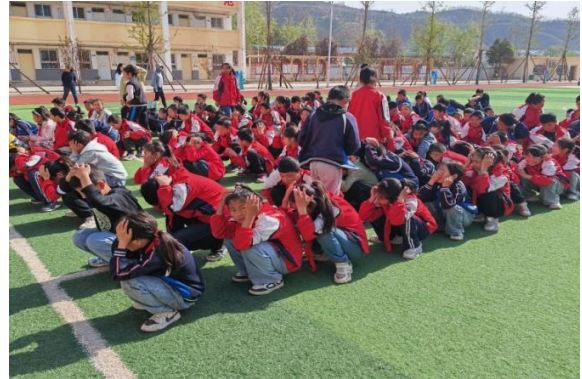
阅读应急·陕西书香校园全国防灾减灾日安全知识阅读主题活动