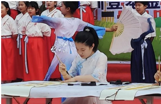
左图：马庄小学歌舞诵读表演