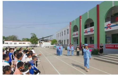
右图：老城小学课本剧展演活动