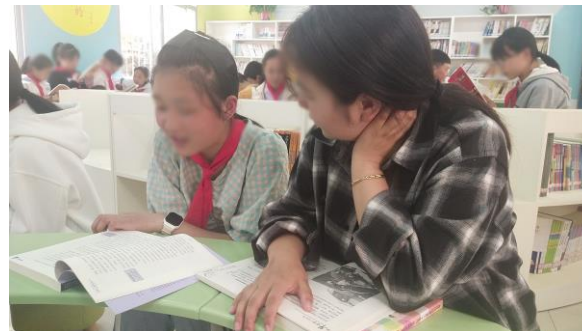
让爱与阅读同行·书香校园感恩母亲阅读主题活动