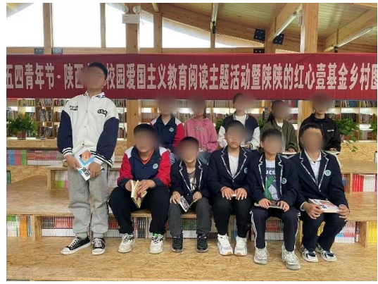
周至县楼观台镇九年制学校主题阅读活动