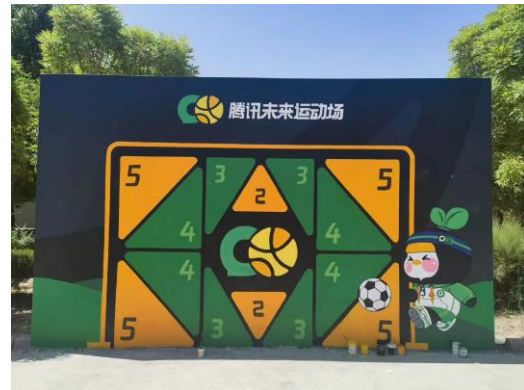
右图：足球墙建设完成