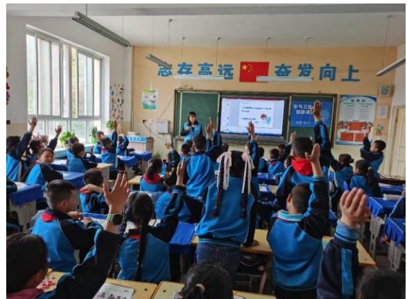
甘肃陇西县的水宝课堂，孩子们踊跃参与