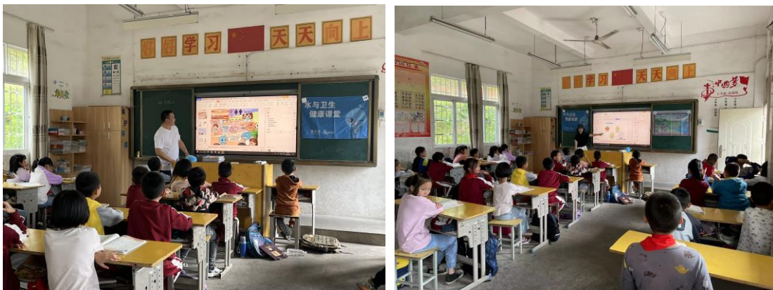
福建宁化县的水宝课堂，孩子们积极互动参与

江西寻乌县执行伙伴给5所学校带去了30节水宝课；辽宁建平县执行伙伴给4所学校带去了23节水宝课堂；山东青岛西海岸新区执行伙伴给1所学校带去了2节水宝课堂；山东临朐县执行伙伴完成10所学校的水宝课；山东五莲县执行伙伴完成4所学校的水宝课；山西吕梁市执行伙伴为7所学校开展了水宝课；陕西宜君县执行伙伴完成7所学校的水宝课；陕西北强县和清涧县执行伙伴在项目学校完成了5节水宝课；新疆温宿县、石河子市、胡杨河市执行伙伴在项目学校完成了46节水宝课；重庆万州区、梁平区和两江新区伙伴为18所学校带去了32节水宝课；