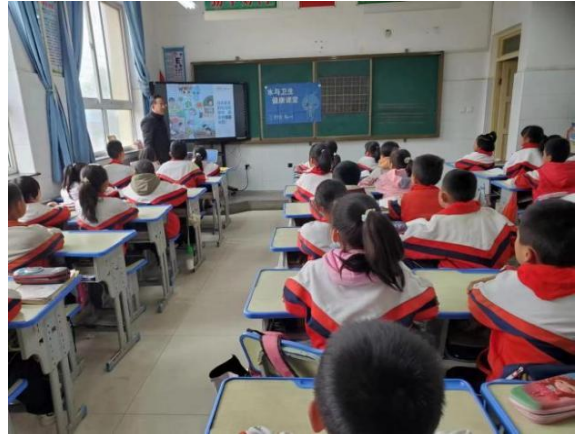
甘肃临洮县项目校的水宝课堂