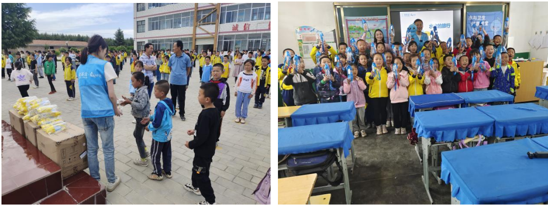
甘肃宁县水杯发放后，儿童们拿到水杯开心合影