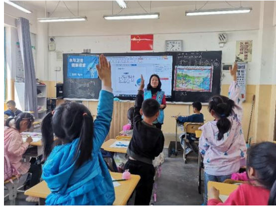
山东青岛西海岸新区项目校的水宝课