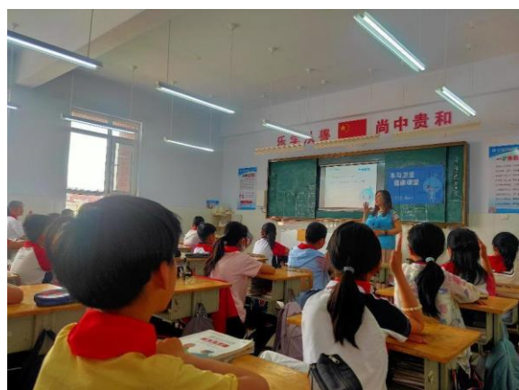
山东五莲县水宝课堂