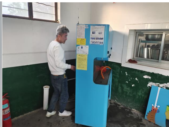
右图：甘肃宁县回访设备运维情况