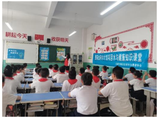
右图：山西吕梁市水宝课