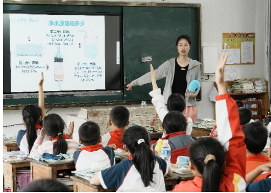
右图：江西德兴市的水宝课堂