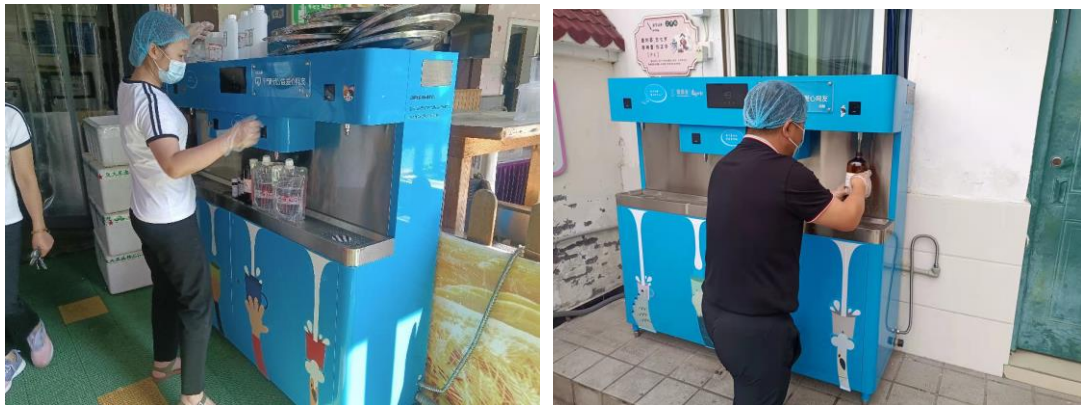
重庆两江新区伙伴正在水质取样