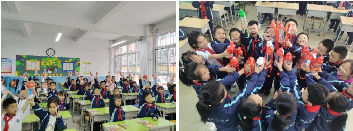
山西吕梁市伙伴给孩子发放水杯