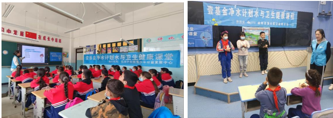
新疆疏勒县水宝课