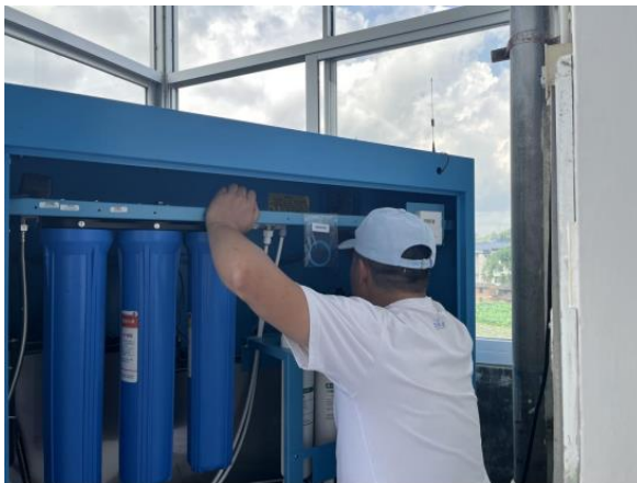
左图：福建宁化县伙伴更换滤芯

5月30日，在黎溪镇大湖小学举行壹基金“净水计划”广东英德项目启动仪式，英德市教育局、共青团英德市委员会、黎溪镇人民政府等相关部门参加了本次捐赠仪式。仪式上，英德市教育局代表进行了致辞，代表所有项目校师生接受捐赠，并表达了对爱心人士的感谢。