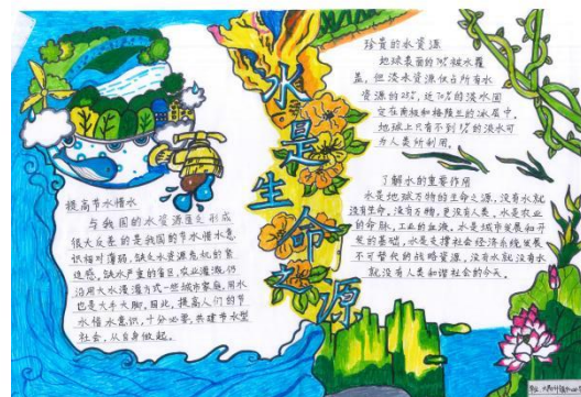
黑龙江大庆市项目校学生手抄报作品