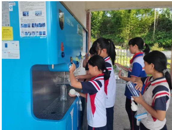
左图：广东英德市项目校设备正常使用