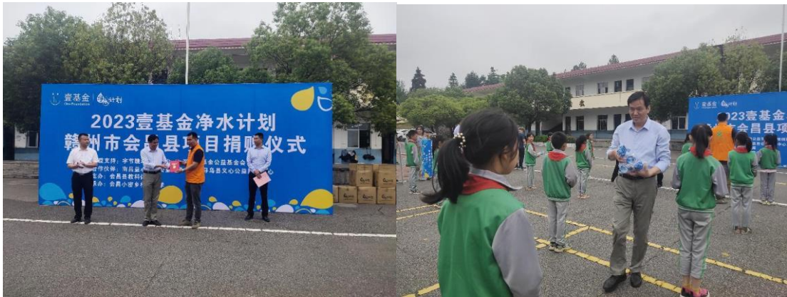
江西会昌县项目启动仪式