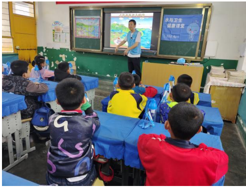
左图：甘肃宁县的水宝课