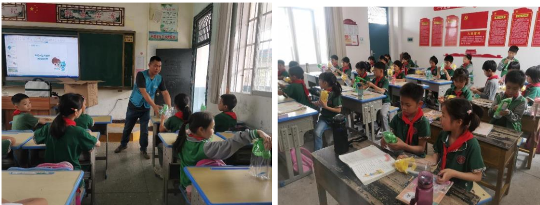
江西寻乌县伙伴正在给孩子发放水杯