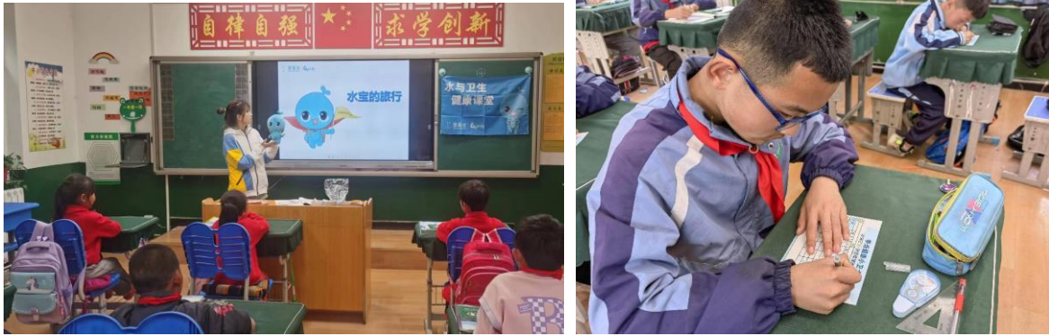
陕西清涧县水宝课