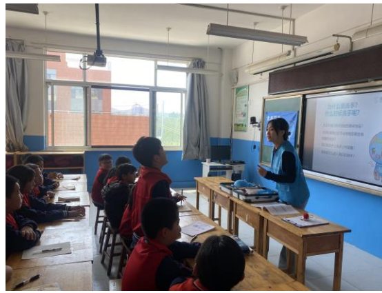
山东临朐县项目校水宝课图片