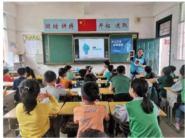
江西寻乌县的水宝课堂