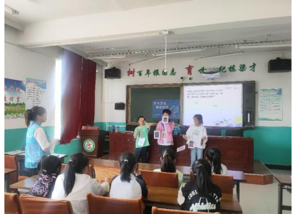
辽宁建平县项目校水宝课