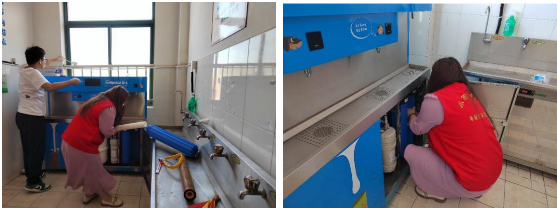
山东青岛西海岸新区伙伴更换滤芯