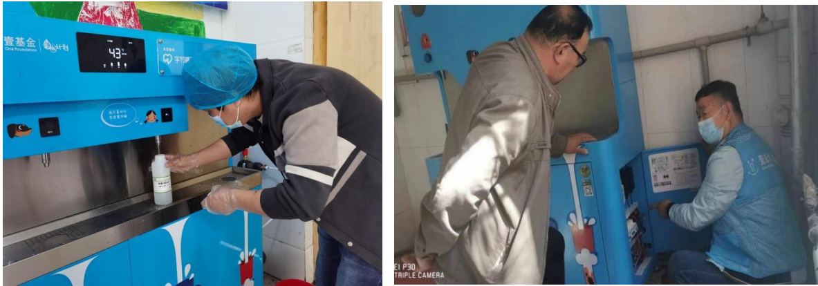
新疆吉木萨尔县伙伴正在取水样及检查设备