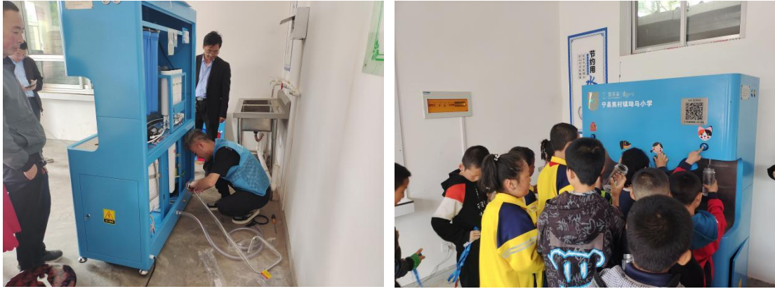
甘肃宁县的净水设备安装后，儿童接水