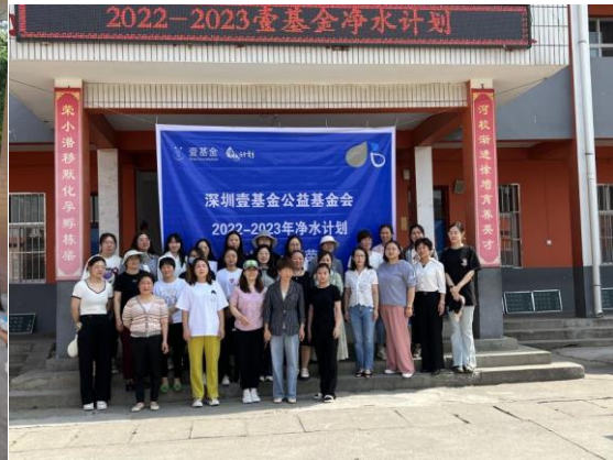
右图：山西万荣县启动仪式