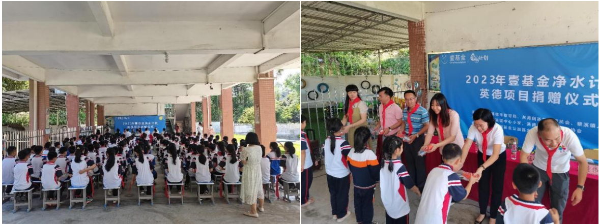
广东英德市项目启动仪式