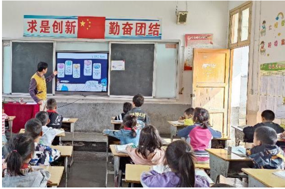
左图：贵州普安县的水宝课堂