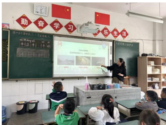
安全教育授课情况

2023 年 3 月，儿童平安项目团队在石棉县教育局的推荐下确定了 22 所儿童平安项目学校，并选择石棉县希望小学、丰乐乡中心小学、草科乡中心小学等 5 所学校开展儿童安全小组相关工作。截至目前，项目学校已建立安全教育教师团队，通过教学视频、教学指引教师并开展安全教育课程的学习，儿童安全小组成员招募等相关工作陆续展开。