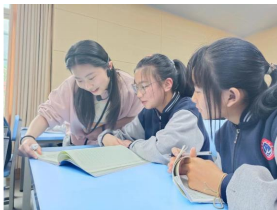
安全教育授课情况

根据项目点调研需求，地震后房屋的损坏的严重，希望能够为学校配备帐篷，应对紧急情况发生时使用，目前供应商正在打样中，以确保帐篷的质量和使用的便利性，预计在 5 月底各项目校应急帐篷配备完成。