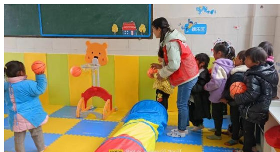
儿童在站点一起玩投篮游戏