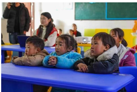
儿童在站点认真听安全知识讲座

2023 年 1 至 3 月，分布在四川省泸定灾后地区的 5 个灾后儿童服务站累计服务 0-12 岁儿童 5,204 人次，开展活动达 201 场次，参与活动的志愿者达 188 人次，短视频、公众号等媒体传播 18 篇。