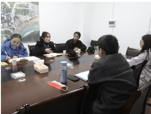
与基层村支两委开展基线调研

第一季度，泸定地震灾后重建安全家园项目点已完成项目应急物资采购工作，部分项目点的应急物资已配置完成。8 家伙伴机构先后开展了基线调研工作，同时开展社区志愿者救援队招募行动，部分伙伴已经根据调研结果陆续制订了项目实施细则方案。3 月，项目团队组织执行机构在成都开展了项目管理者培训。