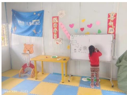
儿童在站点的白板上绘画