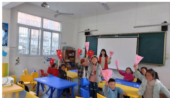
妇女节活动制作手工花束