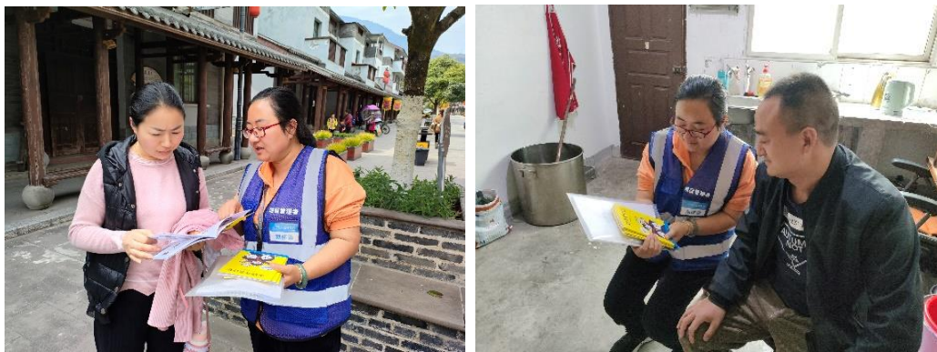
伙伴深入社区开展家园安全宣传与社区动员