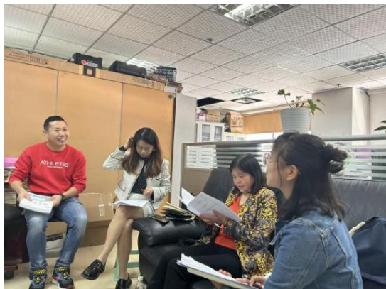
与石棉县教育局沟通