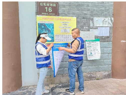
张贴队伍招募公告