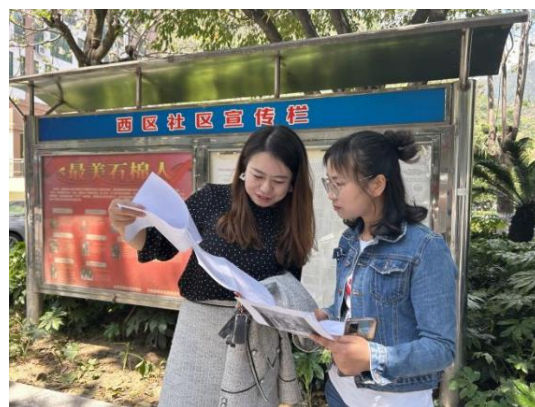
与石棉县安全教育教研员沟通

2023 年 3 月，儿童平安项目团队在石棉县教育局的推荐下确定了 22 所儿童平安项目学校，并选择石棉县希望小学、丰乐乡中心小学、草科乡中心小学等 5 所学校开展儿童安全小组相关工作。截至目前，项目学校已建立安全教育教师团队，通过教学视频、教学指引教师并开展安全教育课程的学习，儿童安全小组成员招募等相关工作陆续展开。