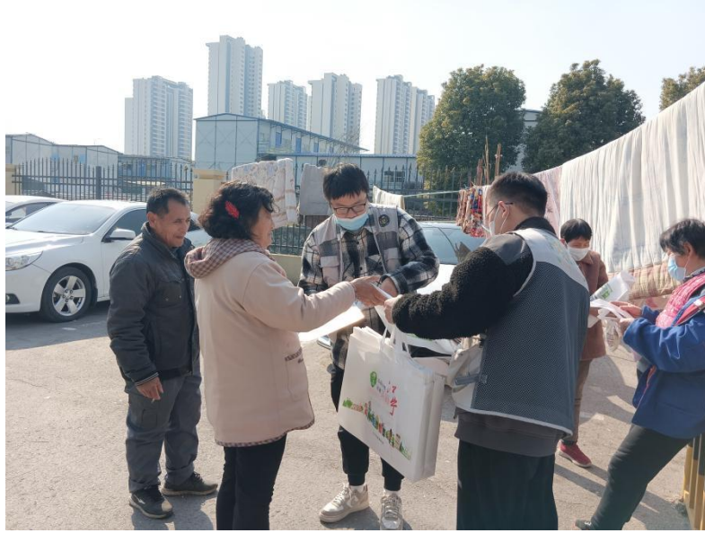
2023年2月15日，喜鹊林在殷巷新寓西一区开展垃圾分类宣传活动。