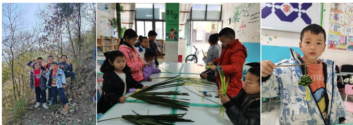
No.128 镇远县东城社区益童乐园站点——【我是小巧手之“棕编”艺术】