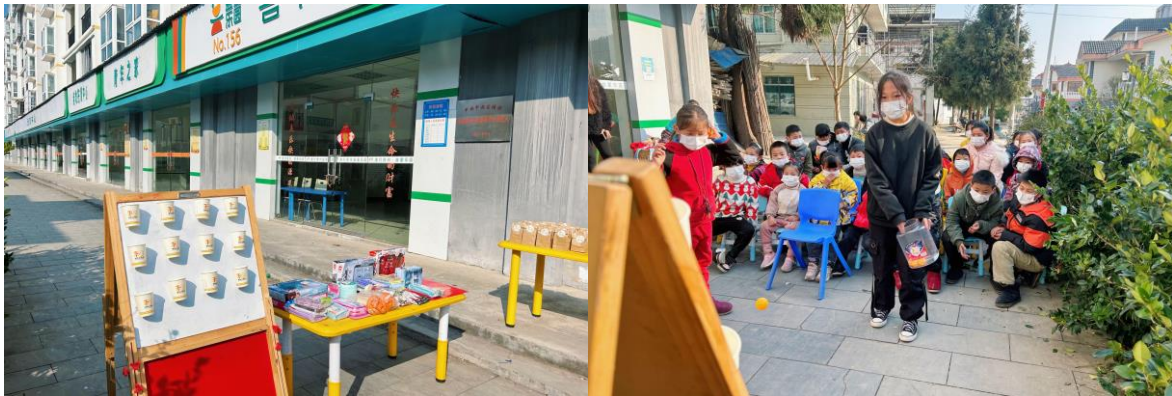
NO.156 遵义市桐梓县九坝镇皂角社区益童乐园站点——【新年活动-投壶】