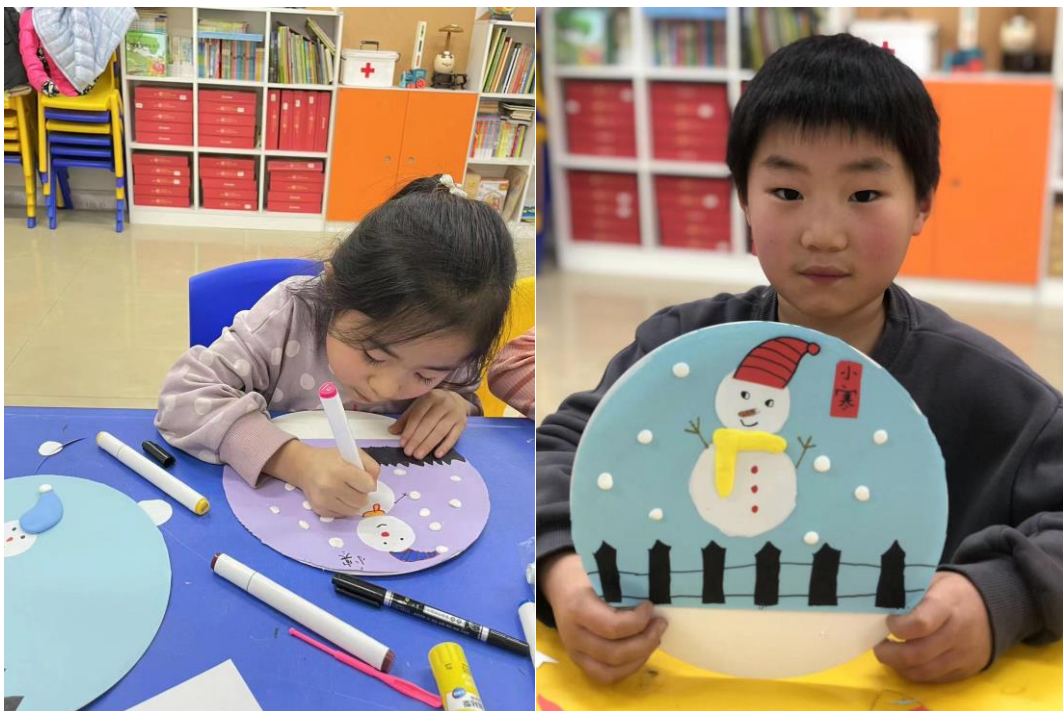
NO.005临西童村站点——【小雪手工活动】