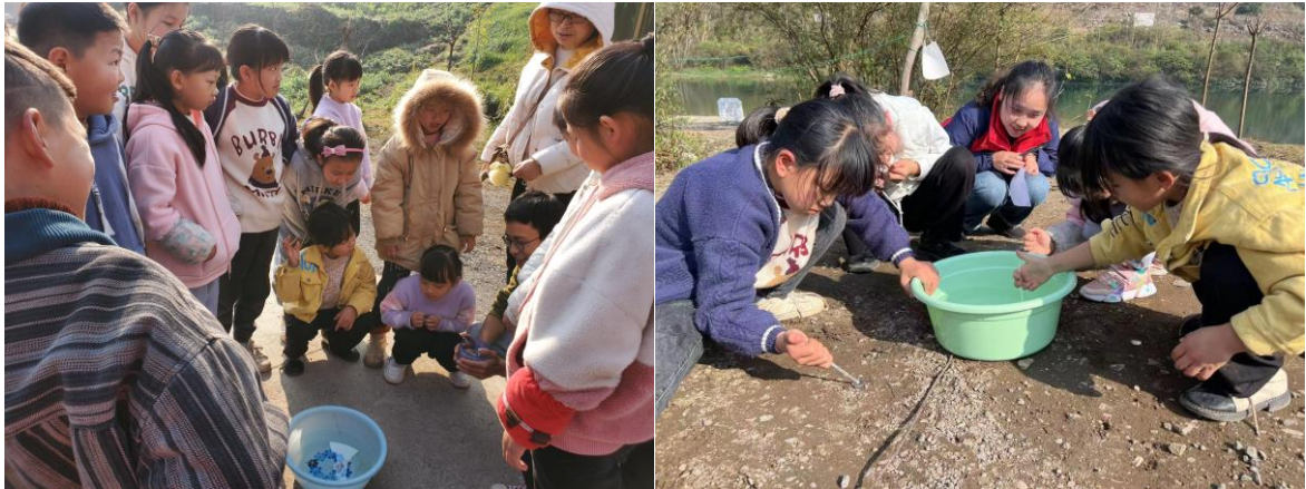
NO.121 清镇市新店镇鸭池河村益童乐园站点——【“关注水环境、守护鸭池河”活动】