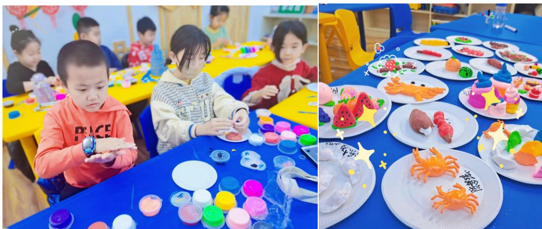
NO.011张家口岭秀城站点——【团团圆圆年夜饭】