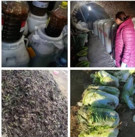
密云筒舍厨余垃圾处理照片