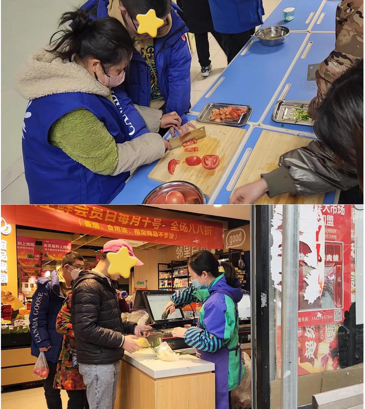
心青年在练习生活技能