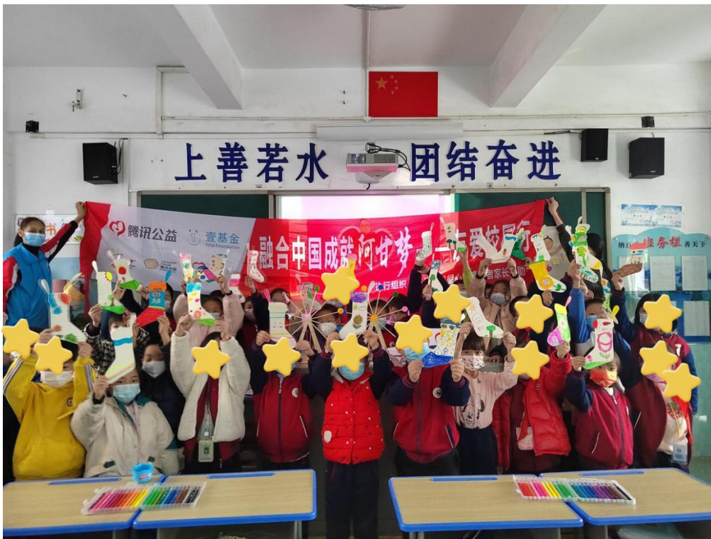
活动结束后的合影

本期友爱校园行活动，让同学们学会大胆表达自己的想法，从故事中感受个体多样性，懂得欣赏自己，尊重别人，发现他人的闪光点。